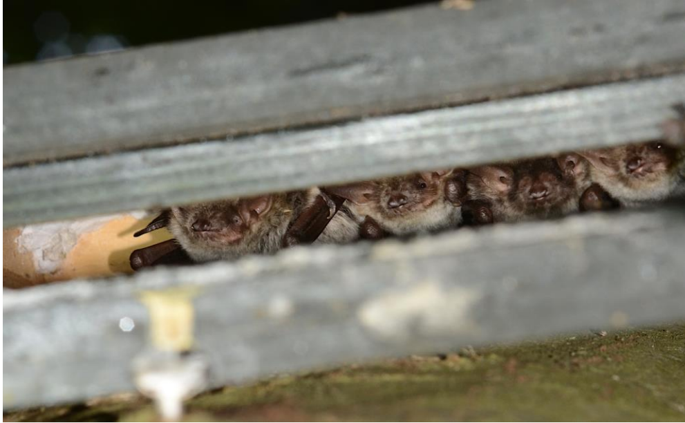
Meervleermuizen (september 2022)

Het totaal aantal ruige dwergvleermuizen per maandelijkse telling (in de periode 2019-2022) in het Egboetswater.