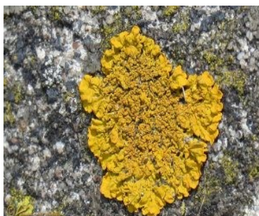
Oranje dooiermos op rots