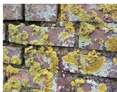
2 soorten op muur