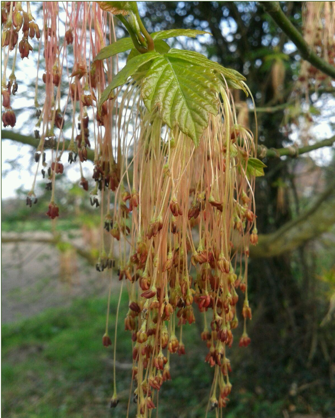
Acer negundo L ( Negundo aceroides Moench) of wel de Vederes.