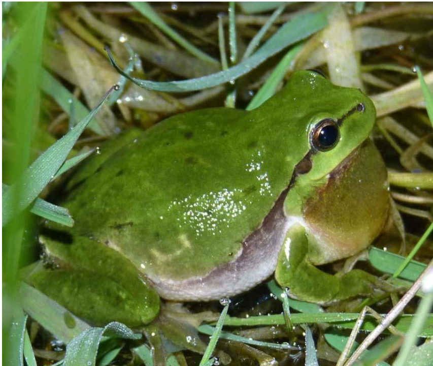
Hyla arborea - Boomkikker