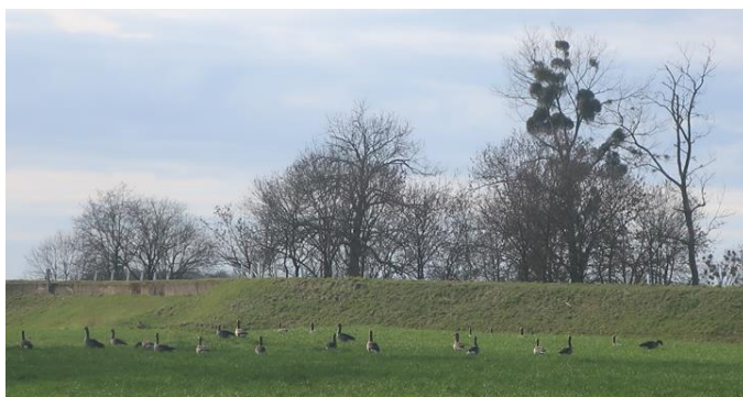
Ganzen bij de Maas

Op pagina 31 staat weer een artikel van Tom Cosemans met lekkere recepten met daslook. Oproep van de redactie aan de lezers om deze eens uit te proberen en hun bevindingen te delen met andere IVN-ers. We zullen ze graag publiceren in de volgende editie. Smakelijk eten. Groeten van de redactie.