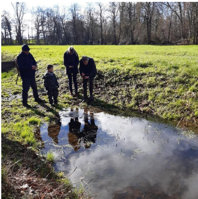
Uitleg over kikkerdril

Hoog in de nestkast van de torenvalk is het vrouwtje waar te nemen. Door de telescoop is ze goed te zien. Ook zien we een biddende torenvalk, op zoek naar muizen. De torenvalk is een uitstekende muizenjager. Helaas staat deze op de rode lijst, het aantal is sterk afgenomen.