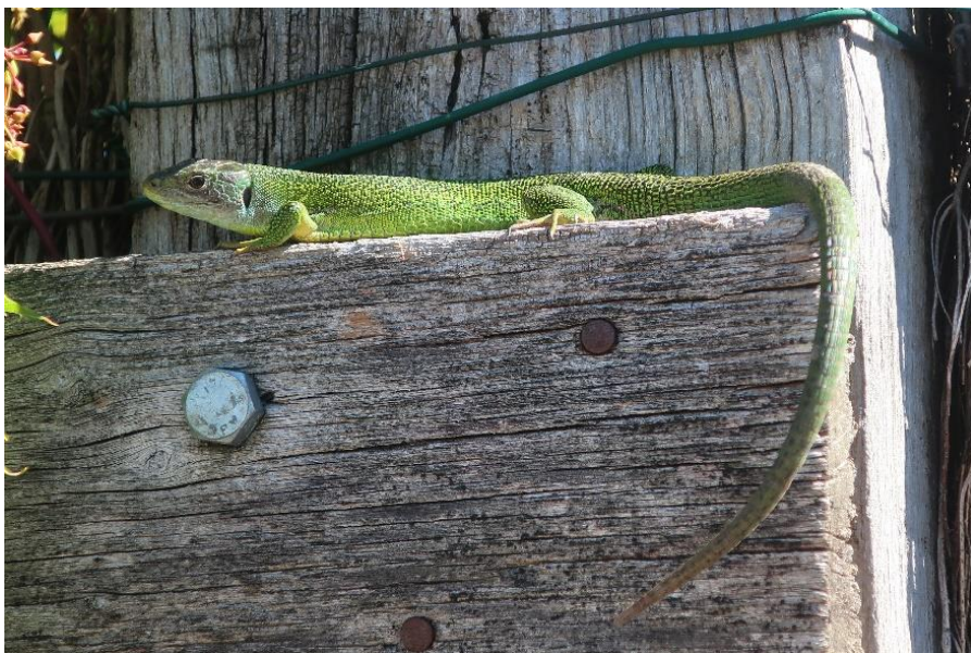
Smaragdhagedis (lacerta viridis) in Eport

Tijdens onze vakantie in Frankrijk, in het departement Vienne, zagen we natuurlijk ook geregeld dieren in het wild. Bij deze een paar foto's.