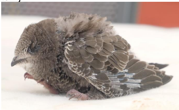
Jonge gierzwaluw uit de Slakberg

In dit geval was het op een zondagmiddag, we liepen terug naar huis vanuit de IVN tuin en zagen op de Slakberg iets zwarts liggen. Onze eerste gedachten gingen naar een verdwaald zwart hondenpoepzakje. Op een gegeven moment bewoog het en bleek het geen zakje te zijn.