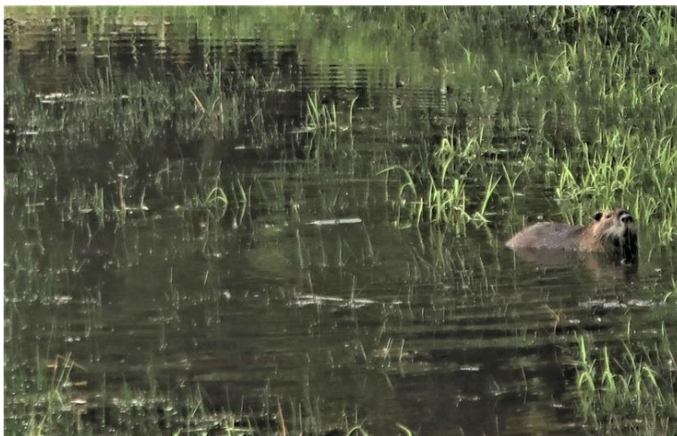
Beverrat (myocastor coypus) in Lac de Murat (Fr)