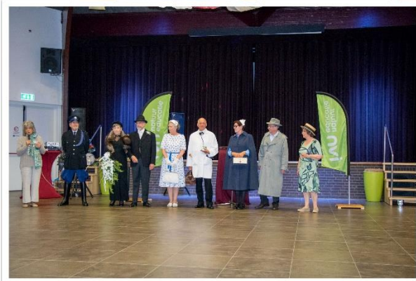
De nostalgische modeshow was een groot succes!