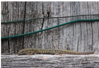
Muurhagedis (podarcis muralis) in Eport (Frankrijk)

Tijdens onze vakantie in Frankrijk, in het departement Vienne, zagen we natuurlijk ook geregeld dieren in het wild. Bij deze een paar foto's.