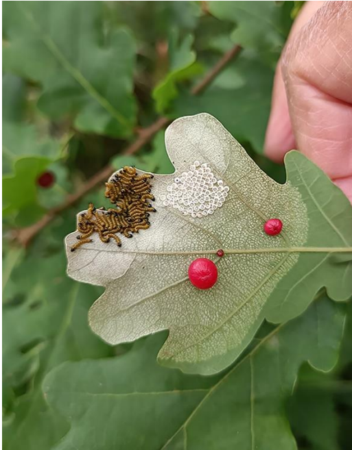
Rode erwengelwesp met rupsjes wapendrager