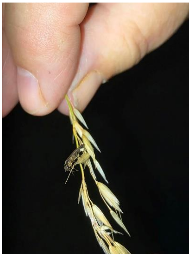
Glimworm op grasspriet

22.00 uur en 03.00 uur, dus vanaf de schemering tot in de nacht en dat alleen in de maanden juni en juli. In feite zijn vuurvliegjes kleine kevertjes met het formaat van ongeveer 8 tot 15 mm. De gevleugelde mannetjes vliegen in het rond en zorgen voor de lichtjes terwijl de vrouwtjes op de grond leven. Bij het zien van zoveel lichtjes in de nacht roept dat een speciaal gevoel bij iedereen op. Het is een wonderbaarlijk gezicht om honderden vuurvliegjes door de nacht te zien opgloeien. Het ene kevertje dooft zijn lichtje terwijl een ander weer opgloeit en dat bij tientallen tegelijk... een prachtig en ook wonderbaarlijk gezicht en dat zo dicht bij huis. Ik kan alleen maar iedereen, die hiervoor in de gelegenheid is, aanraden een keer deel te nemen aan een toekomstige vuurvliegjeswandeling. De moeite meer dan waard!