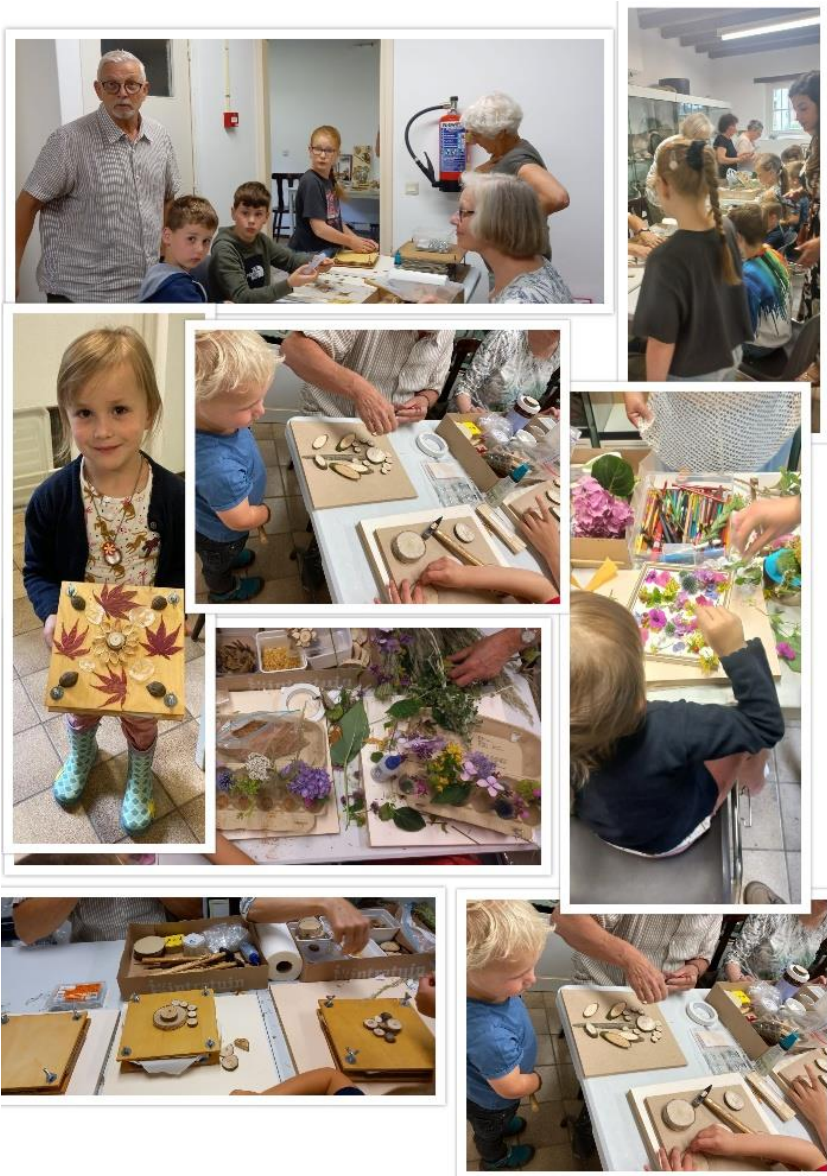
Foto's gemaakt door de vrijwilligers van de kidsmiddag