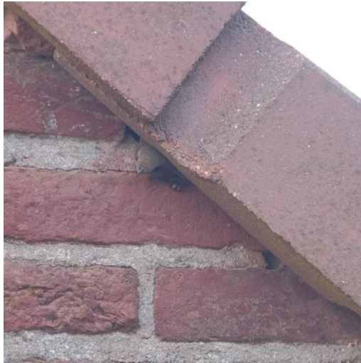
kopje steekt onder de dakrand uit

De gierzwaluwen zoeken naar een geschikte plek om hun nestje te maken. Kantoorgebouwen, kerken of andere hoge plekken, zoals onder de dakpannen van onze burens.