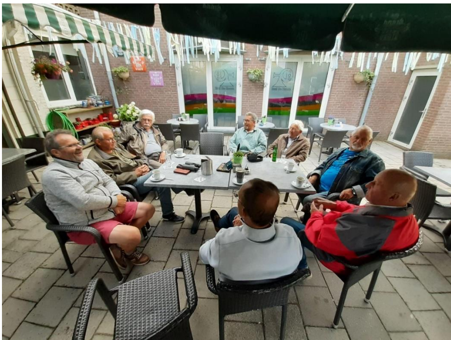
De afsluiting in Meers

problemen mee, en verlenen alle medewerking als we met de werkgroep komen tellen. Meers is een goed leefgebied voor de huiszwaluw met veel water en vliegende insecten. Vooral op muggen, die vaak in zwermen hoog in de lucht vliegen, zijn ze dol. Ook in Meers blijven de aantallen redelijk constant. Zoals gebruikelijk sluiten we de zwaluwtelling in Meers af met een drankje.