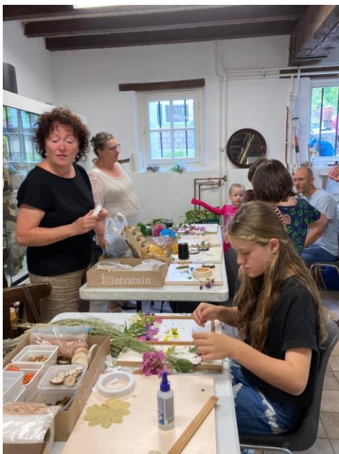
Vanwege de dreigende regen is er binnen gewerkt

Zondag 4 september wordt er van 14.00 tot 17.00 uur weer geknutseld. Thema: Help de vogels de winter door!