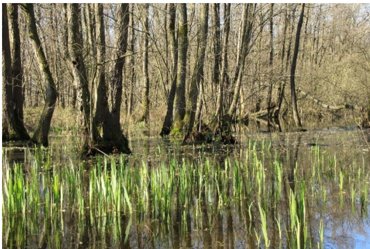
In het Niersdal

En houdt het hier dan bij op? Nee hoor, want vergeet niet dat er een feest voor alle leden (en partners) op de planning staat voor zaterdagavond 11 juni. Ik adviseer om de dansschoenen alvast uit de kast te halen en te voorzien van een flinke opknapbeurt, ze gaan het die avond namelijk zwaar te verduren krijgen.