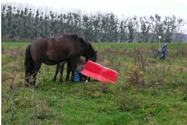
Een beeld van het opruimen bij de Maas

Het vorige nummer was een superdik nummer! Deze keer iets minder maar we zijn onze schrijvers en fotografen dankbaar voor hun inzendingen. Gelukkig zijn er weer mogelijkheden voor activiteiten en wandelingen. We verwijzen naar bl. 40 en verder. Kijk ook eens naar bl. 7: IVN Elsloo gaat een feestelijke avond organiseren. De overstromingen in juli hebben zoals gewoonlijk veel rommel achtergelaten. Een aantal actieve leden heeft zich aangemeld om op te ruimen. Zie hiervoor bl.10 en verder. Geweldig!