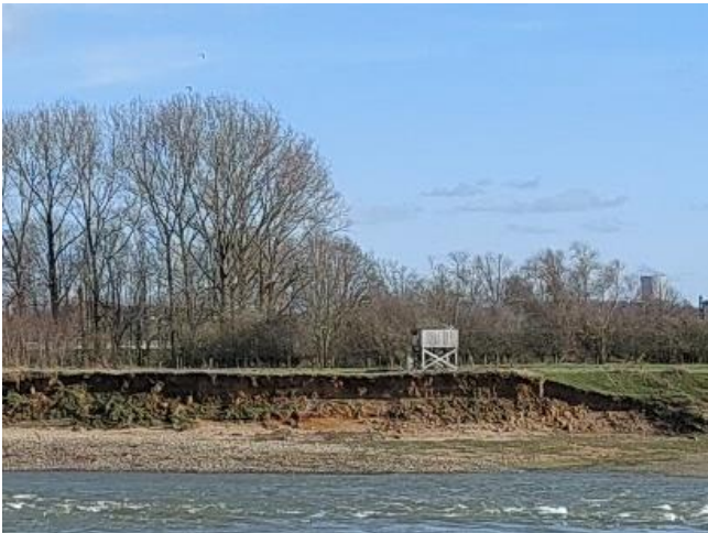
Aan de rand van de afgrond?