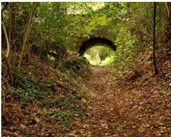
Holle weg richting Kaakstraat