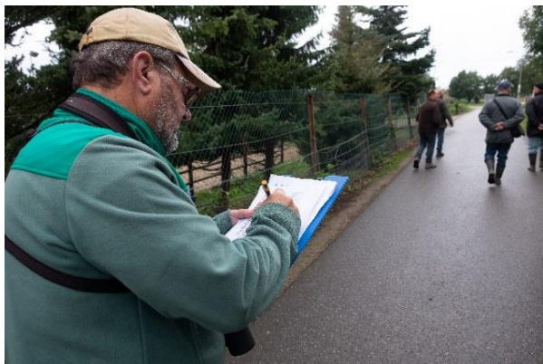
Nol houdt de tellingen bij

Op de volgende pagina staan de waarnemingen van 2 oktober 2021.