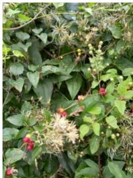
bosrank: bloei, bes, zaad