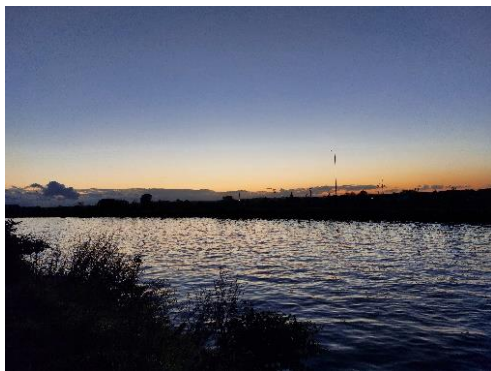
Julianakanaal Elsloo