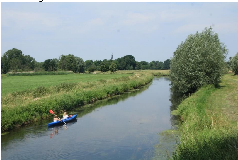
Niersdal bij Houstenbruch

Net over de grens bij Venlo ligt een fraai natuurgebied, het Grenspark Maas-Swalm-Nette. Tijdens deze bus-tocht bezoeken we onder leiding van Olaf Op den Kamp drie gebieden in het Grenspark. We beginnen bij de Krickenbecker Seen, een gebied met diverse meren waarop watervogels leven. Deze meren ontstonden door het wegbaggeren van turf. Hier ligt ook het voormalige jachtslot Krickenbeck. Verborgen in het bos zien we de restanten van het Grand Canal du Nord, een kanaal dat Napoleon liet graven. Al in de Spaanse Nederlanden werd deze Schelde-Maas-Rijnverbinding gepland: de Fossa Eugeniana (1626-1629) maar niet afgemaakt. In de Franse tijd werd het plan opnieuw opgepakt en nooit voltooid, ofschoon gedeeltes de basis van enkele moderne kanalen vormen. Hier maken we een wandeling van circa 6 km.