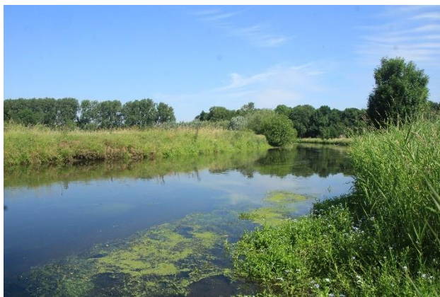
Niersdal bij Schlick

Ons tweede doel is het Nettetel waar we het Roerdompproject zullen bekijken. Hier is langs de fraai meanderende Nette een natuurgebied ontstaan met bevers. De waterral, een bijzondere vogel die leeft verborgen aan oevers en dichtbegroeide rietmoerassen en bijna niet vliegt, de grote zilverreiger en allerlei soorten eenden, ganzen en zwanen. Bijzonder zijn de vele futen op de Nette. Deze wandeling is circa 3 km lang. 's Middags rijden we naar de Niers waar we een wandeling van 4 km maken. We lopen door het bos bij Klooster Wachtendonk en langs de uiterwaarden van de Niers