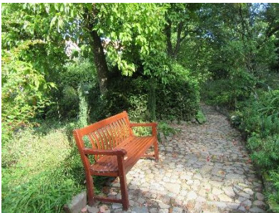
Botanische tuin

Hub moet nog hartelijk lachen om de volgende gebeurtenis: “Het is gebeurd bij het uitproberen van een kinderactiviteit met schepnetjes in de Hemelbeek. Al te enthousiast gooide één van de collega's het schepnetje in het water, waarbij hij het evenwicht verloor en helemaal kopje onderging - tot grote hilariteit van de anderen en tot grote eigen schaamte. Persoon in kwestie moest helemaal naar huis om zich te verschonen en op te drogen, we hebben hem die avond niet meer terug gezien...”