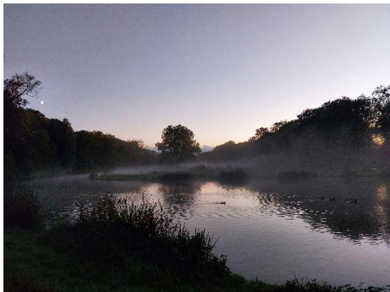
Kasteelvijver Elsloo bij avond

Ook in de nieuwsbrief, op de website en facebook wordt u op de hoogte gehouden van de ontwikkelingen.