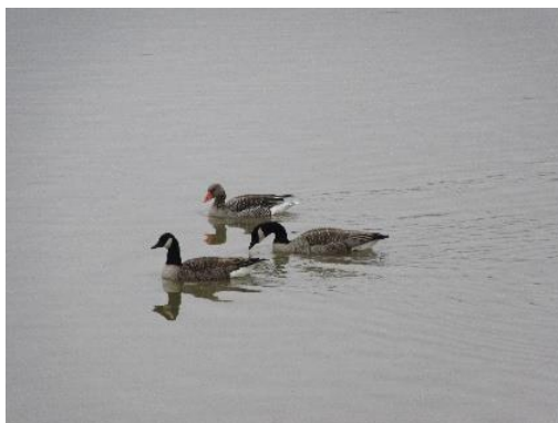
Ganzen op de Maas