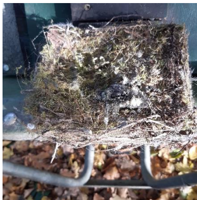
Dood vogeltje in nest

Van de nestkasten op de parkeerplaats was een nestkast niet bewoond. De vleermuiskast hebben we niet intensief gecontroleerd; wel vermoeden we dat ze uitgevlogen zijn.