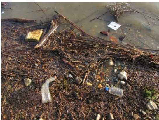
Er blijft van alles achter op de oevers van de Maas... zie bl.25