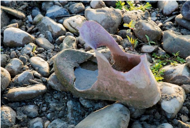
Een gevonden “schat”...

In totaal noteerden zij ruim 47000 stuks afval, voornamelijk plastic. Drinkverpakkingen blijven de Nederlandse rivieroever teisteren. Bij vier op de vijf metingen werden plastic flesjes gevonden en bij twee derde van de metingen blikjes. De resultaten tonen de urgentie aan van statiegeld op plastic, wat vanaf 1 juli gelukkig een feit is. Nu het statiegeld op blikjes nog.”