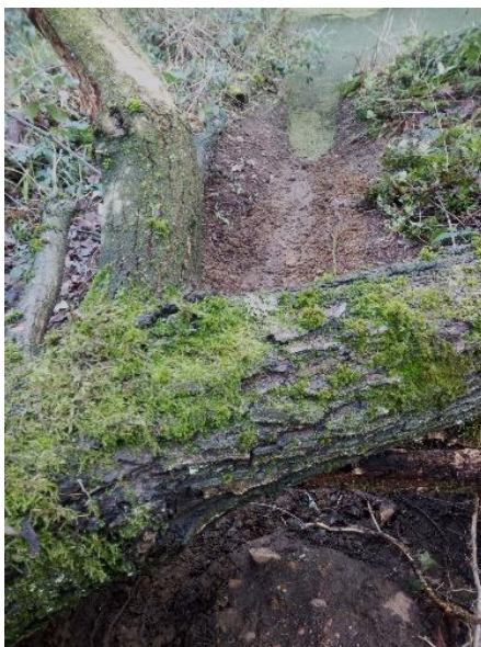
Sleepspoor van de bever

Deze dam ontdekte ik toen ik tussen het spoor en de hemelbeek liep. Het is het werk van de beverfamilie die met behulp van omgeknaagde bomen en takken uit het bosschage langs de beek dit bouwwerk heeft gemaakt. (Zie ook pagina 28)