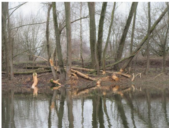
Hele bomen gaan om!