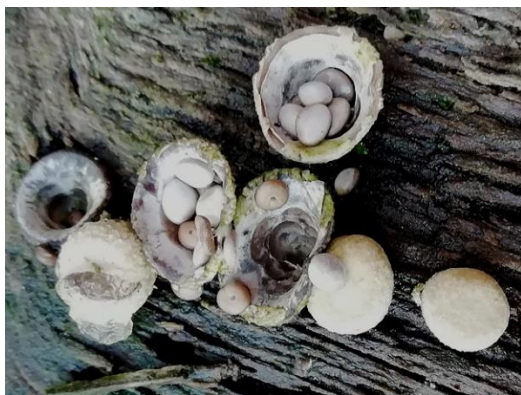
Trilzwanmetjes op hout

De vindtijd is van oktober tot laat in de winter. Nestzwammetjes zijn klein en kwetsbaar en ze zijn te vinden op dood hout en in dichte groepen. Ze komen algemeen voor maar zijn erg kwetsbaar. Dus als je er vindt, graag voorzichtig ermee omgaan.