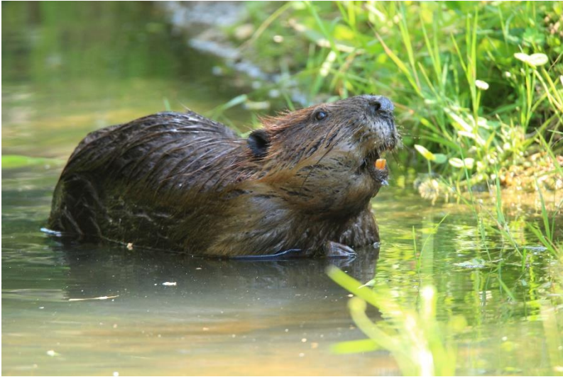
De bever heeft opvallende snijtanden.