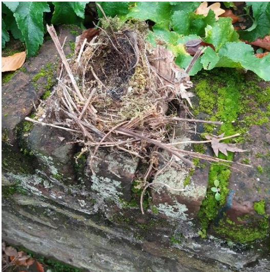
In nestkast grauwe vliegenvanger. Een nest met een ruwe structuur.