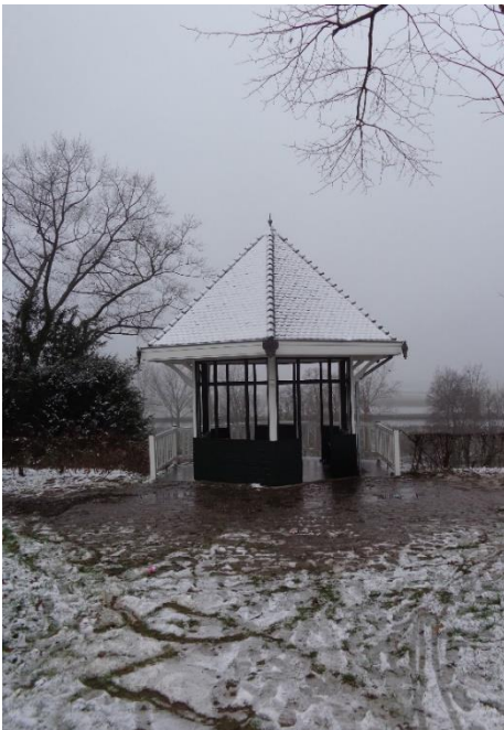
Uniek: sneeuw op het theehuisje