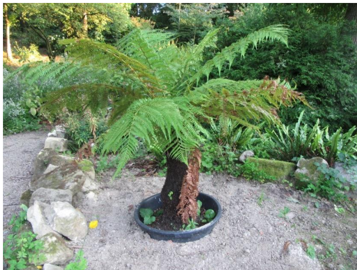
Een zeldzame boompalm