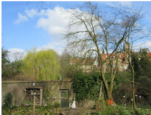
De tuin 22 maart 2017

vergaderingen plaats op de woensdagochtend, in de open lucht. En laat dit nou nog eens supergezellig zijn, ook. Mooi om te vermelden: er hebben zich 3 nieuwe actieve leden voor de tuinwerkgroep gemeld.