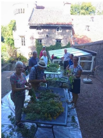
Het samenstellen van de kroetwusj