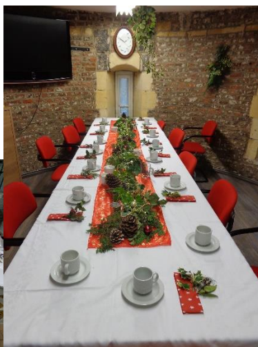
De goed verzorgde ruimte in de toren