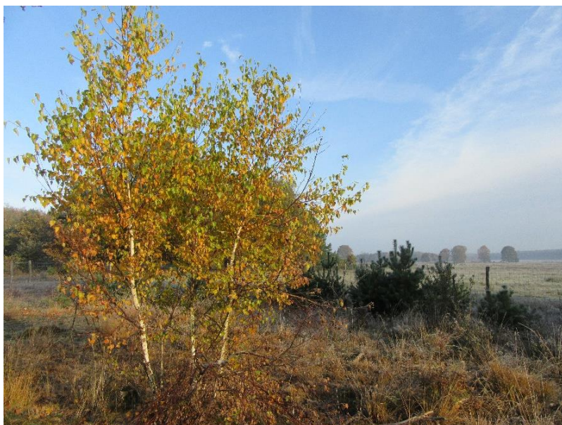
Berken in het najaar