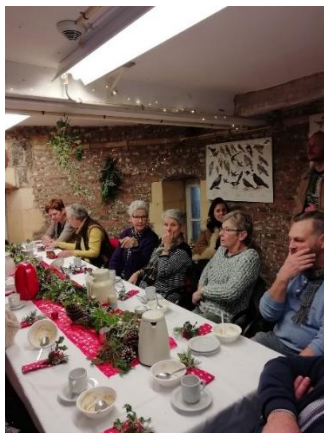
Gezellig naperen bij een kop soep