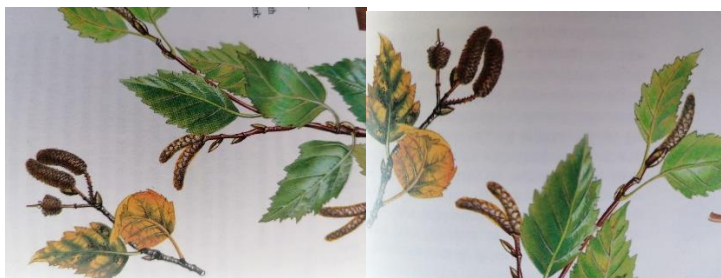
Illustraties uit Gids voor geneeskrachtige planten; Reader's Digest, 1979

De ruwe en zachte berk zijn moeilijk van elkaar te onderscheiden. Typisch voor de berk is de gladde zilverwitte schors; deze wordt bij de ruwe berk later donker. De witte schors, laat als de boom ouder wordt, los in witte papierachtige stroken met evenwijdige dwarse strepen. De bladeren van de ruwe berk zijn ruitvormig, lang toegespitst en scherp dubbel gezaagd. De bladeren van de zachte berk zijn kleiner, eivormig tot driehoekig afgerond en aan beide zijde licht behaard. Vanaf april-mei zijn er lange hangende cilindrische mannelijke katjes (10 cm) met een oranje kleur op de bovenste takken en kortere en dikkere min of meer rechtop staande vrouwelijke katjes (5 cm) op de lagere takken. De vruchtjes zijn glad met twee vleugeltjes.