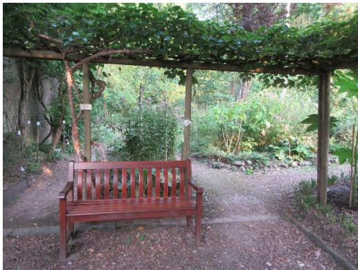
Een kijkje bij het sfeervolle terras

Harry Lemmens, "kartrekker" van het project jubileum IVN 2020