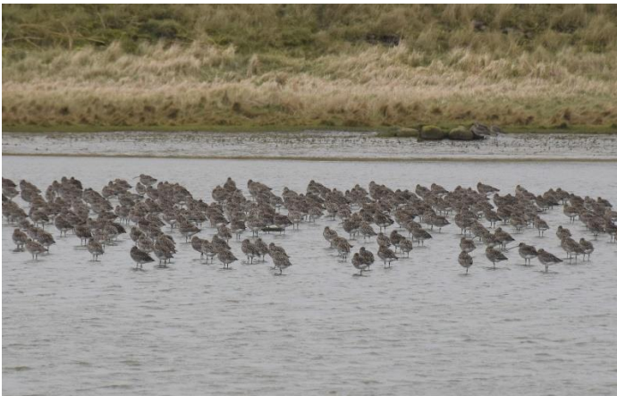
Wulpen bij de Waddendijk