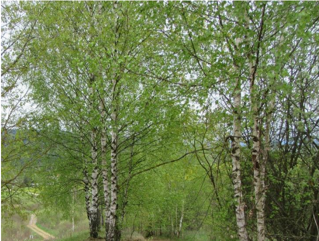
Berken in het voorjaar

“Betula” is vermoedelijk afgeleid van het Keltische woord “betu” wat slaan betekent en refereert naar het oude Scandinavische gebruik om met berken takjes op de huid te slaan om de bloedsomloop te bevorderen, zoals bv na een bezoek aan de sauna.