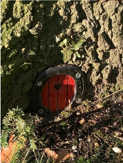
Nog enkele impressies van de winterwandeling