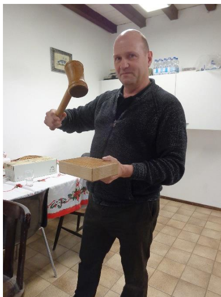
De voorzitter met zijn nieuwe hamer!