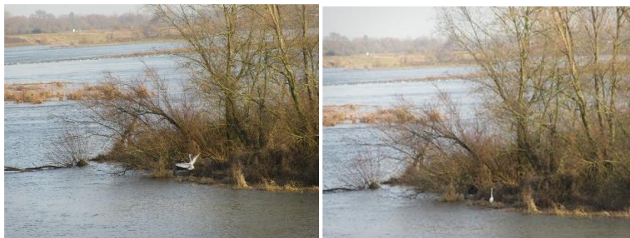
Grote zilverreiger aan de Maas bij Kotem (B). Zo landt hij!

Een gezelschap van 13 vogelaars verzamelde zich bij de Witte Börstel in Meers voor de vogelwandeling. Het was goed weer om te spotten, echter over de Maas hing nog een laag mist. Na de gasten welkom te hebben geheten gingen wij op pad, gewapend met een verrekijker en een stethoscoop. Wij werden verrast door een tweetal overvliegende kraanvogels, een machtig gezicht. Tijdens onze tocht, vrij drassig langs de Maas, gingen wij richting de Maasband, naar het nieuwe uitkijkplatform. Onderweg zagen wij grote zaagbekken, smienten, kuif- en wilde eenden, de grote zilverreiger, putters, graspiepers, kramsvogels etc. Kortom, het aanbod was voldoende en de aanwezigen waren enthousiast over de mooie kijkjes door de stethoscoop. Het nieuwe uitkijkplatform is een aanwinst voor de vogelaars! Na afloop hebben wij nog onder het genot van een kop koffie met vlaai bij de Witte Börstel de ochtend geëvalueerd en eenieder ging tevreden huiswaarts.