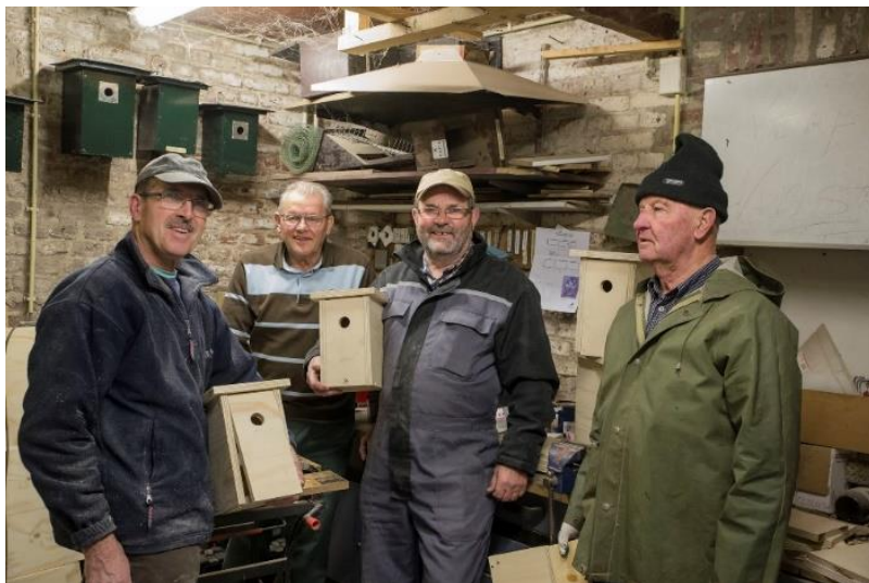
De harde bouwers na gedane arbeid!

De groep hoopt op deze manier dat ze een welkome bijdrage hebben geleverd en dat de natuurlijke bestrijding van de eikenprocessierups op deze manier daadwerkelijk hulp biedt binnen de gemeente Stein.