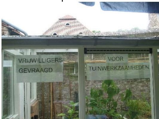
De tuinwerkgroep kan altijd mensen gebruiken!

Er gebeurt enorm veel binnen onze levendige club, de werkgroepen staan bol van de initiatieven en geplande werkzaamheden. Gelukkig hebben wij een grote groep van enthousiaste vrijwilligers en komt het allemaal warrampel ook nog eens voor elkaar – hulde! Van diverse initiatieven wordt in deze Kroetwusj verslag gedaan. Heel veel leesplezier!