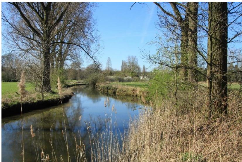
Niers bij het Hobbes Bergske in natuureservaat Grasheide.

In het vorige nummer van de Kroetwusj is helaas een verkeerde foto geplaatst bij de busreis. Onderstaand de goede foto, gemaakt in het natuureservaat. Onze excuses.