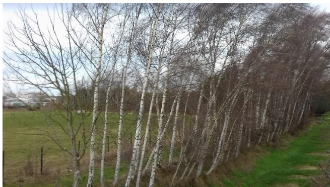
Berken in de winter

Thee van het verse blad bevat meer etherische oliën dan het gedroogde blad en is hierdoor bloedzuiverend en ontzurend.