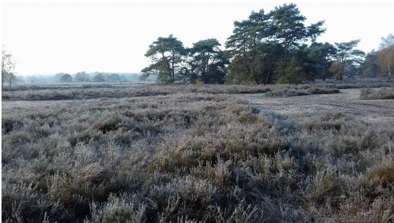
De hei in november

Onderweg kwamen we bij een bunker uit de Tweede Wereldoorlog waar we even pauzeerden. Na afloop werden we op het terras van de Salamander, onder het genot van koffie, (met of zonder vlaai) verrast door live muziek van het ensemble "Prior". Ze speelden speciaal voor onze tafel een aantal countrynummers. Er gingen nog net geen beentjes van de vloer. Waren te moe denk ik. Het was goed vertoeven daar en we vonden het jammer dat we naar huis moesten. Wie er niet bij was heeft veel gemist. Maar, in augustus/september 2020 is er weer een kans. Kijk hiervoor in de kroetwusj of op de site.