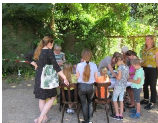
drukte voor en achter de tafel