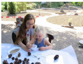
jongste vrijwilligster en deelnemster