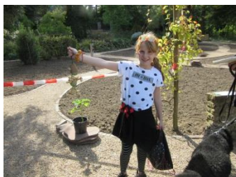
trots op resultaat