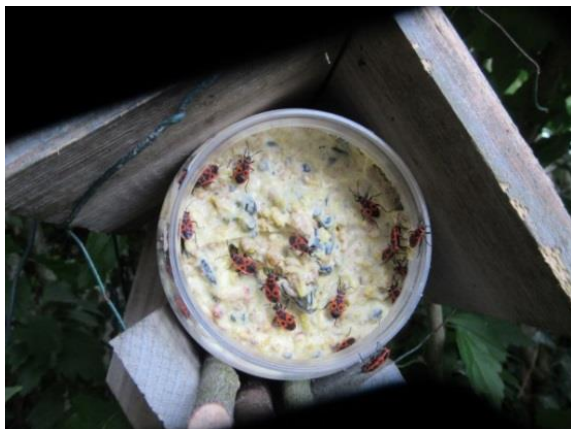
Vuurwantsen in pindakaaspotje