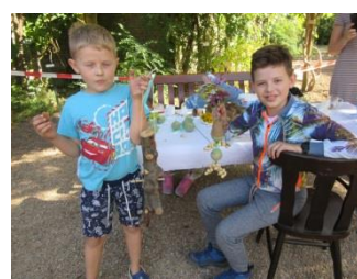
pauzeren voor de camera