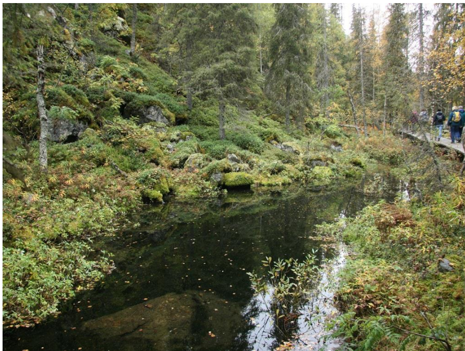
Niers bij het Hobbes Bergske in het natuureservaat Grasheide

en zwanen ontstaan. Bijzonder zijn de vele futen op de Nette. Deze wandeling is circa 3 km lang. 's Middags rijden we naar de Niers waar we een wandeling van 4 km maken. We lopen door het bos bij Klooster Wachtendonk en langs de uiterwaarden van de Niers zelf. Deze stroomt hier door een uitgestrekt vlak gebied tussen extensieve graslanden door. We sluiten de dag af met een bezoekje aan het fraaie plaatsje Wachtendonk met zijn historische huizen.