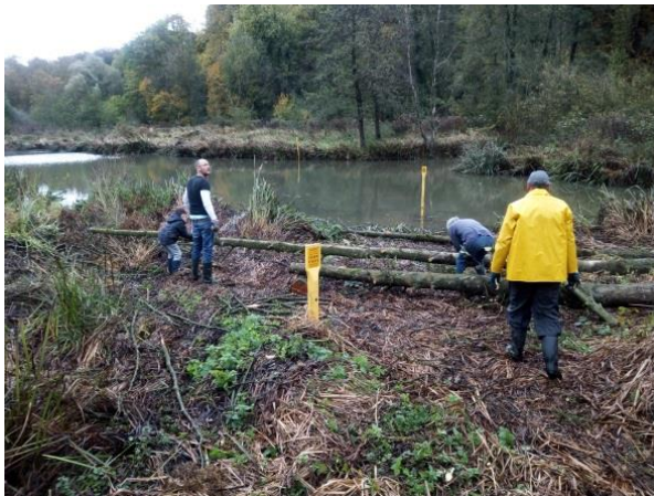
Natuurwerkdag 2 november 2019