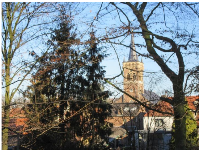
Elsloo op een winterse dag