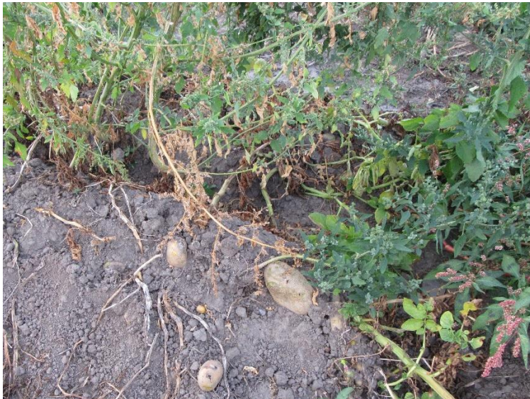
Na de oogst

Gekookte aardappelen (tenzij jonge aardappelen in de schil gekookt) en zeker verwerkte aardappelen (puree, gebakken frieten, ....) hebben een hoge glycemische index en passen dus niet in een afslankend dieet.