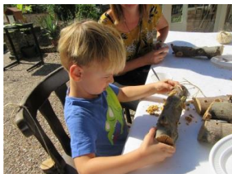
nog een gaatje vullen?