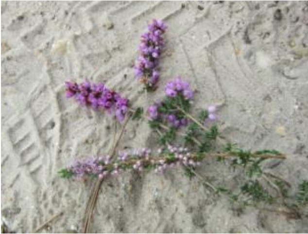
struikheide onder dopheide boven