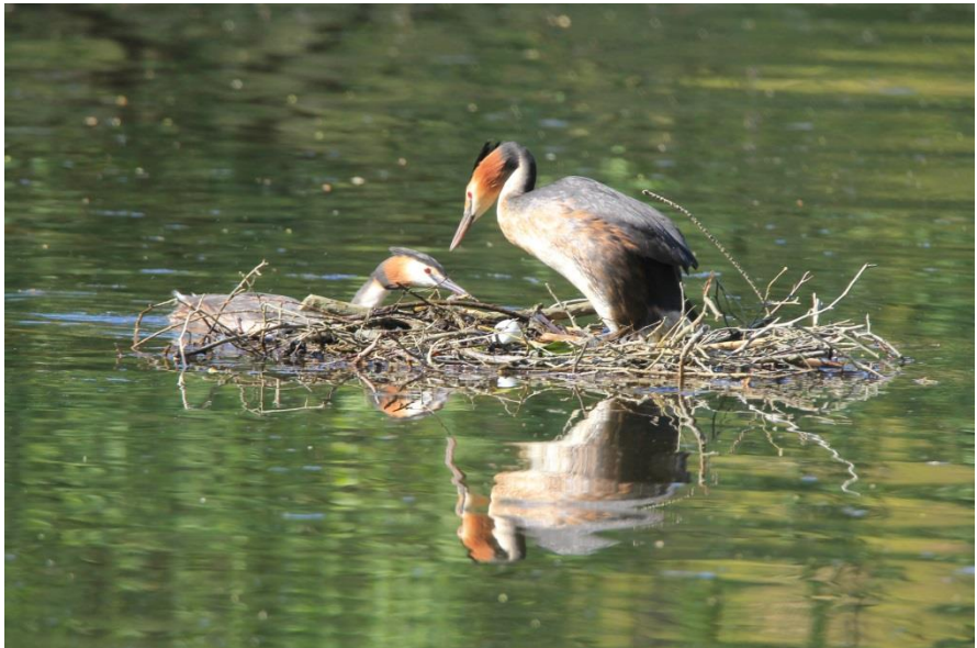
Futen bij de nestopbouw

Vertrek om 9.00 uur bij de kasteeltoren en de Botanische Tuin in Elsloo