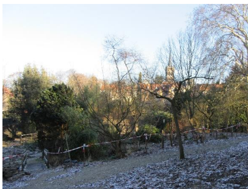
Tuin en kasteel in januari 2019

En de terugreis? Neen, diezelfde weg terug, in volledige duisternis, dat was teveel gevraagd. Veiligheidshalve toch maar via St. Pietersvoeren en De Planck naar Mestreech. Al met al was dit een ontzettend leuke ervaring, zeker voor herhaling vatbaar. En wie weet, neemt een ander lid van onze dassenwerkgroep een volgende wandeling voor zijn/haar rekening