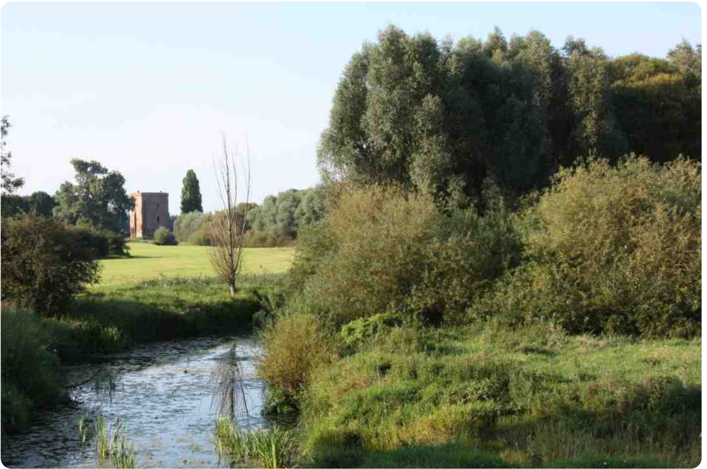
Uitzicht op de Nijenbeek