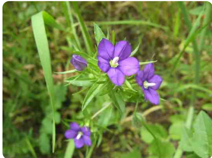
Presikhaaf. Helaas weet ik niet meer welke plant dit was. Hij is er even mooi om