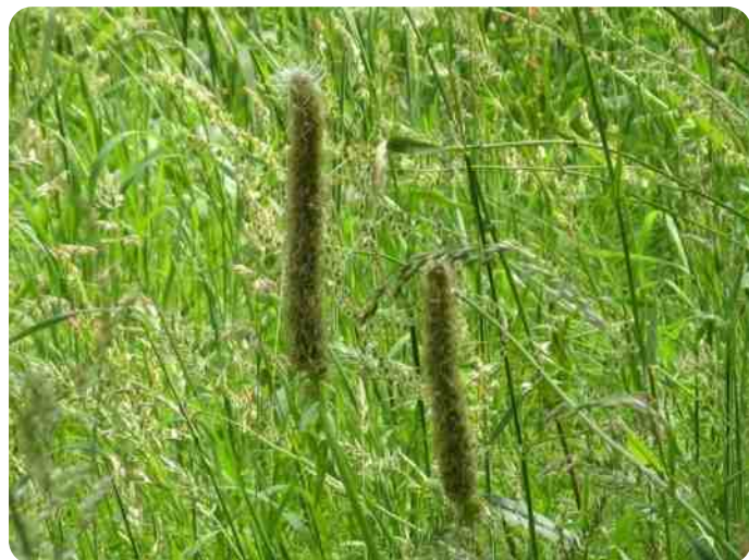
Presikhaaf. Twee bloemtrossen van wilde weite.