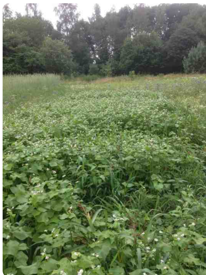
de akker zomer 2018