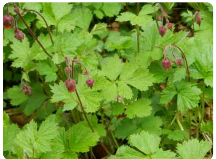
Middachten. Knikkend nagelkruid.

vluchthaven is vrij vruchtbaar met een weelde van prachtige bloeiende planten die elders vrij zeldzaam zijn; - het laagste deel van diezelfde dijk is bedekt met asfalt (nu gelukkig gebroken) en biedt een habitat voor warmte- en droogteminnende planten; - het helikopterplatform lijkt daarop, maar grenst direct aan een stuk schrale grond waar o.m. bremraap parasiteert op walstro en klaver, en ratelaar op gras. Tot zover de beschrijving. Het terrein ligt even ten westen van Tolkamer en bleek alles bij elkaar vrij klein en goed te overzien. Het is wonderbaarlijk hoeveel verschillende wilde planten hier groeien. Heel bijzonder vond ik de blauwe bremraap die overigens ook onze begeleiders in grote vervoering bracht. De plant is een zeldzame verschijning in grasland die volgens 'Heukels' parasiteert op duizendblad en alsemsoorten. Het is hier toch al mooi om te zijn, want al die plantenpracht is te zien vlakbij voorbijvarende schepen, onder een zwevende ooievaar en met hier en daar een veldleeuwerik (of waren het toch graspiepers?). Helaas overviel ons iets voor de geplande eindtijd een hoosbui, die iedereen hals over kop de auto injoeg en vervolgens was de excursie opeens voorbij. Ik ben er nadien niet meer geweest en kan dus verre van garanderen dat alles er op deze plek - gelet op de in de beschrij-