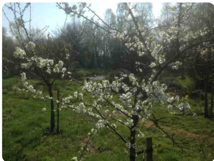
Fruitbomen in bloei

Wat de akker betreft: het valt op dat er dit voorjaar erg veel vogels in de tuin zitten en de verscheidenheid groot is. Zo zijn er putters, kepen en sijsjes in groten getale: toeval of niet?