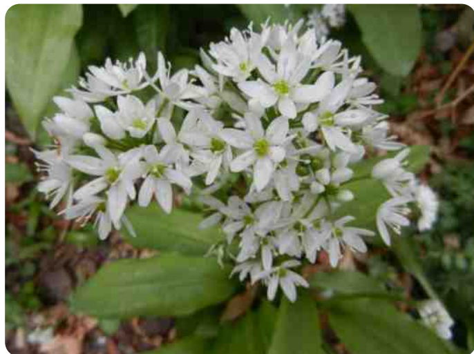
Middachten. Bij een van de woonhuizen op het landgoed bloeide langs de weg veel daslook.

De drie excursies van de KNNV-cursus voerden ons naar fraaie terreinen rond Middachten, bij Lobith-Tolkamer en naar de Arnhemse Heemtuin in Presikhaaf. Het zijn alle drie aanraders en ze kunnen ook buiten cursusverband worden bezocht. Maar een rondleiding door iemand die de locatie en de flora (en fauna) aldaar goed kent, voegt zonder meer nog een dimensie toe. Overigens was de heemtuin in Presikhaaf in feite een noodbestemming, omdat eigenlijk een excursie naar het Ganzenei in Cortenoever was gepland. Vanwege de aanwezigheid van enkele zeldzame broedvogels - o.m. de kwartelkoning - konden wij daar niet terecht en weken wij uit naar de Heemtuin in Presikhaaf. Deze tuin en een paar bevlogene gidsen slaagden erin voorlopig het Ganzenei - hoe mooi ook - geheel uit de gedachten te verdrijven.