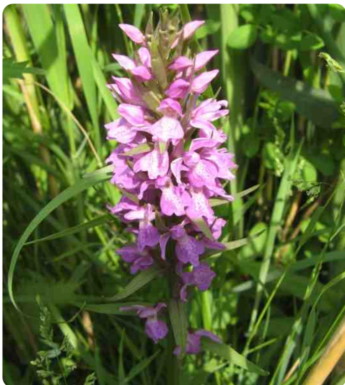
Presikhaaf. Grote muggenorchtis.

Verkiezingen 2019 (Provinciale Staten en Waterschappen)