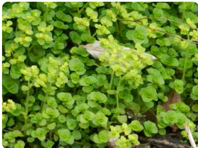
Middachten. Paarbladig goudveil.