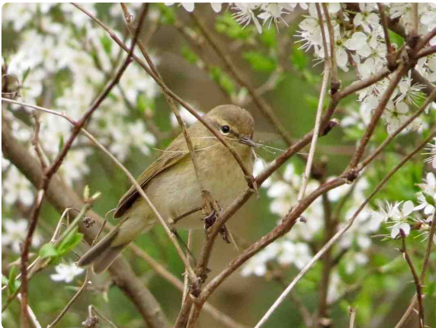
De tjiftjaf ( Phylloscopus collybita )

Bij het verschijnen van deze uitgave van Het Groene Blad is de lente al weer enige tijd ingetreden. Door het zachte weer begon het lentegevoel dit jaar al vroeg met de komst van de voorjaarsbodes onder de vogels de tjiftjaf (begin maart) en de fitis (half maart). Wellicht heeft u beide vogels inmiddels al vaak gehoord en gezien.