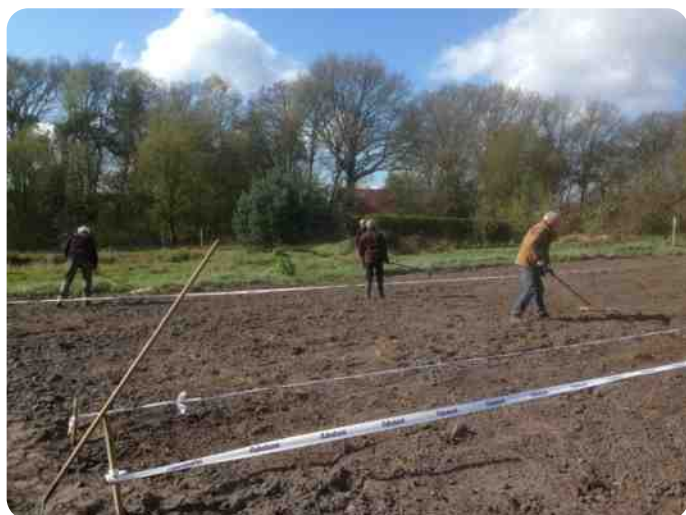
Vorbereidingen voor het inzaaien van de akker april 2019