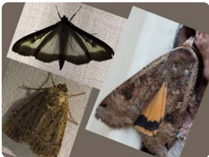
links boven: Buxusmot links onder: pyramide vlinder rechts Huismoeder

Ik wil hierbij de reeds genoemde IVN-ers bedanken die zo geestdriftig hebben meegewerkt aan dit toch wat onverwacht opgeborrelde idee.