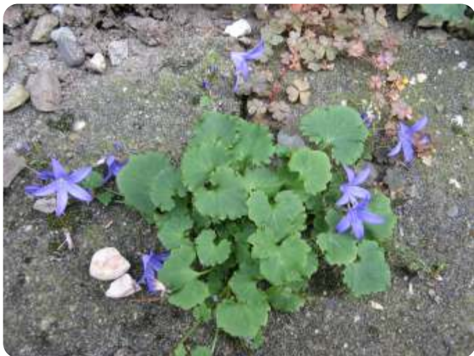
Kruipklokje in het achterpad

Vanwege de afkomst uit tuinen vind je kruipklokjes, als ze er zijn, vooral nog dichtbij tuinen: vooral in steden, op en langs tuinmuurtjes, langs gevels, tussen bestrating, op en rond trapportalen, in oude binnentuinen, in hofjes en op grachtenmuren. In gunstige jaren kunnen ze zich daar behoorlijk uitbreiden: het is een exootje dat zich zo snel kan uitbreiden dat het andere planten overwoekert. Maar het is wel een mooi exootje.