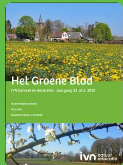
Foto 1. uitzicht op de kerk van Hall.