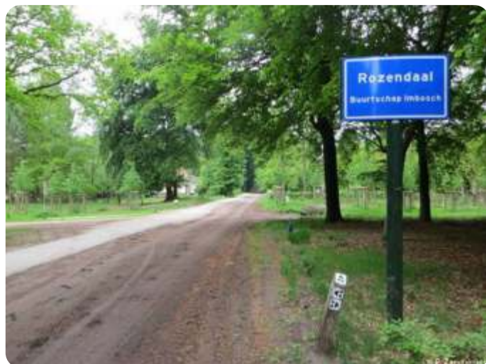
Buurtschap Imbosch tegenwoordig