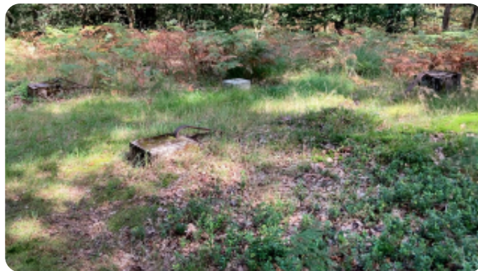
resten van oude fundamenten

Een dassenburcht kan soms wel jaren niet in gebruik lijken, maar toch komen de dassen er telkens weer terug. En wat te denken van de 'draaihalsspecht', die hier nestelt. Dat hij in het rapport niet genoemd wordt, is niet zo gek. Ga je in het najaar dan is de situatie natuurlijk anders dan in het voorjaar of de zomer. Er zijn vele soorten vogels gespot. Ik noem er enkele: de uil, verschillende roofvogels, gierzwaluwen, grote gele kwikstaarten, huismussen, vleermuizen en ga zo maar door. Op de grond leven, naast de das en het zwijn, zandhagedissen, hazelwormen, boommarters, eekhoortjes en vossen. Als je niet goed kijkt, zie je ze niet. En wat te denken van de vele wildwissels die over het terrein lopen.