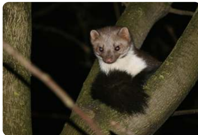
Steen marter

rest. Ik blijf uiteraard binnen het IVN werkzaam en bij problemen kan een nieuwe secretaris me altijd benaderen.