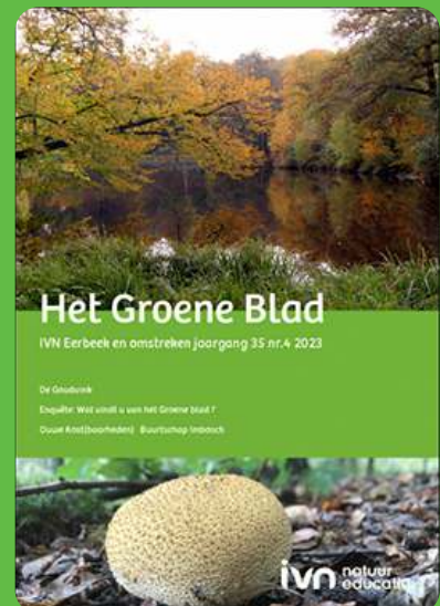
Foto boven, Vijver Bij Landgoed Voorstonden Foto onder, Gele aardappelBovist