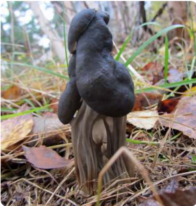
Zwarte kluifzwam

Van tevoren heeft 'paddenstoeldeskundige' Miep mij al meegetroond naar de zwarte kluifzwam, een ouder grijs exemplaar en een jonge zwarte met een klein grijs vlekje. Later zullen we daar ook bekerzwanmetjes ontdekken, gewoon op de parkeerplaats.