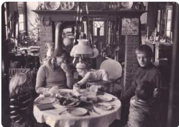
de lelijke haard, Lam groen ontbijt