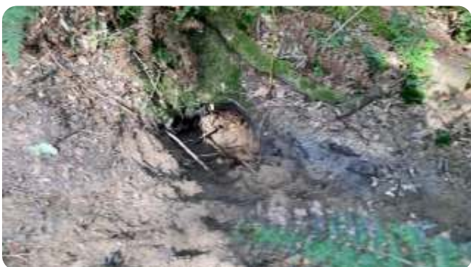
Verse ingang met zand en pootjes