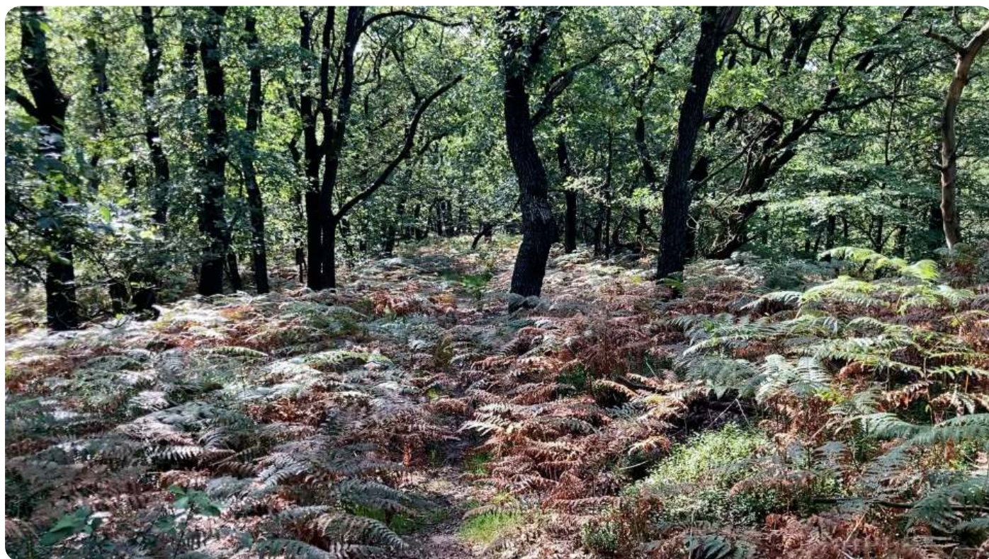
Hier moet de toegangsweg komen