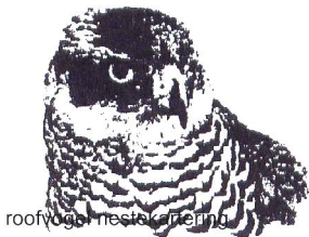
roofvogel, nestkast met jong