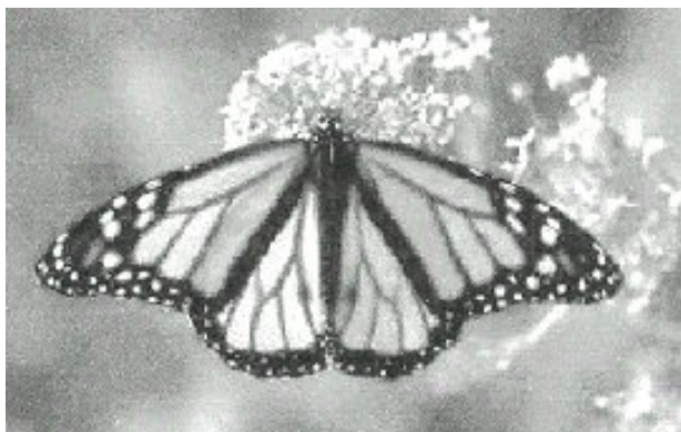
Monarch op Milkweed

BM staat bij mij het voor: de B edreigde M onarch