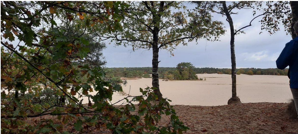
De provincie wil ook inzetten op natuurversterking.