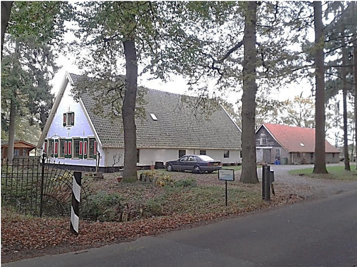
Boerderij Gerritshoeve aan de Wieksloterweg in Soest.