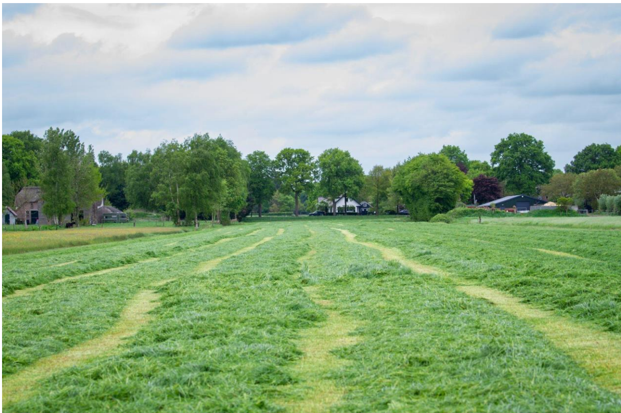
Gemaaid grasland aan de Birkstraat in Soest.

● Het Ontwerp-UPLG ligt van 6 januari tot en met 16 februari 2026 ter inzage. Inwoners, ondernemers en organisaties kunnen vanaf dat moment hun zienswijze indienen. Het provinciebestuur roept alle betrokkenen op hiervan gebruik te maken zodat deze zienswijzen meegenomen kunnen worden in de totstandkoming van het definitieve UPLG dat, naar verwachting, in de loop van 2026 door Gedeputeerde Staten wordt vastgesteld.