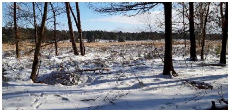
Titel: Landgoed den Treek

● Loop mee met de Geo-Doorstapwandeling Treeker Punt in Leusden. Trek je wandelschoenen aan en ontdek samen met de natuurgidsen van IVN Amersfoort de bijzondere omgeving van het Treekerpunt, het Treekermeertje en de omliggende natuur van Landgoed Den Treek. Het is hartje winter, dus we houden er een lekker wandeltempo op na. Zie