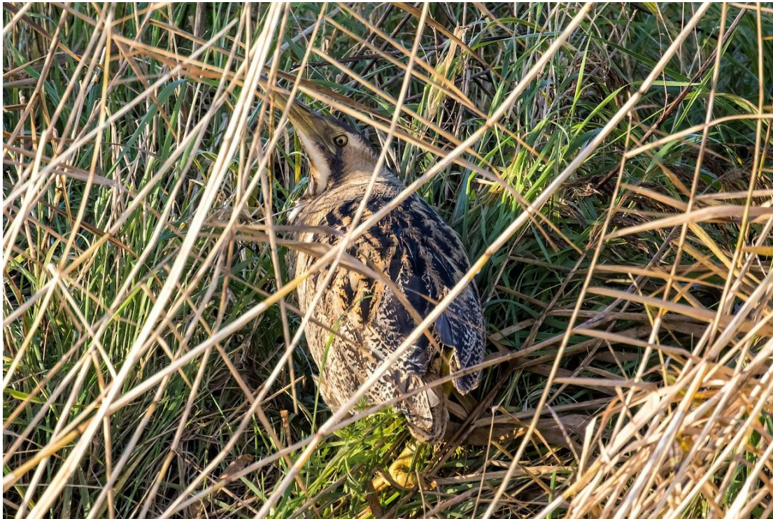
Roerdomp.