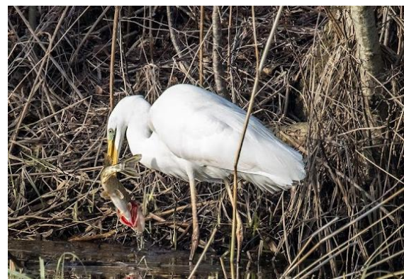
Grote zilverreiger.