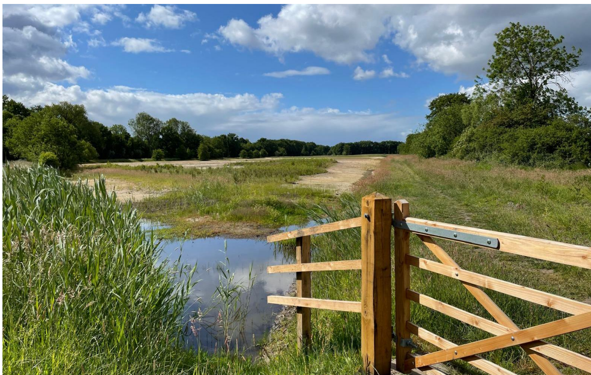
Impressie van het tweede, pas gereedgekomen gedeelte van het nieuwe natuurgebied Melksteeg in Soest. Zie pagina 5 en 6