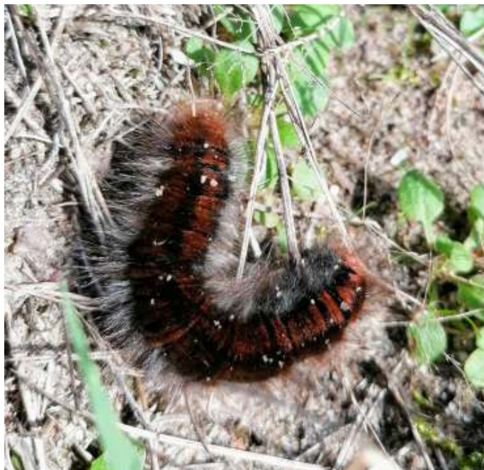
Veelvraat ( Macrothylacia rubi )