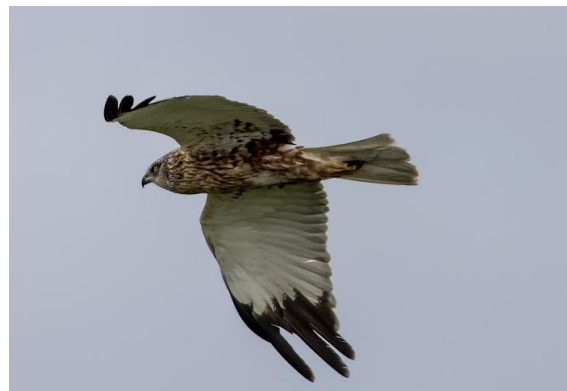
Bruine kiekendief.