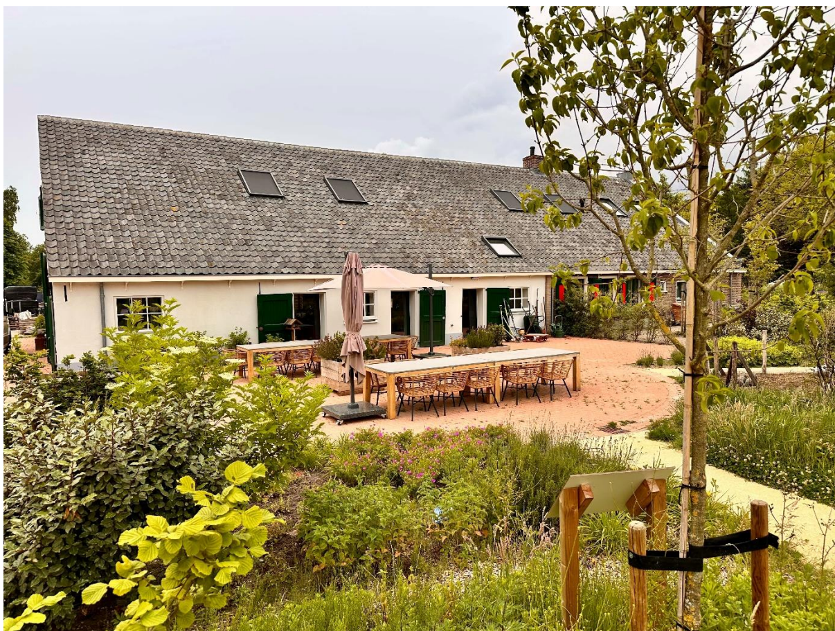
De Willemshoeve in Soest.