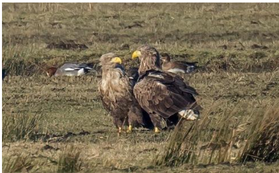
Zeearend adulten.

Hieronder twee artikelen uit De Grote Ratelaar van IVN Gooi en KNNV Gooi.