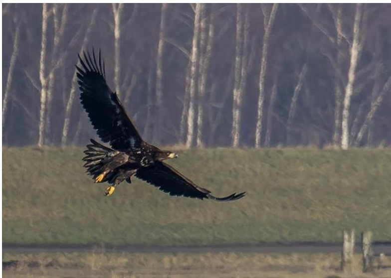
Zeearend juveniel.

● Hieronder de waarnemingen van vogels rondom de plasjes van Vitens aan de Westdijk in Bunschoten op 3 mei 2025, tijdens de telling van 9.00 tot 10.00 uur. Het was op de dijk geheel onbewolkt, windkracht 2 noord en de temperatuur was +12°C. Deze keer hebben we in totaal 41 vogelsoorten geteld.