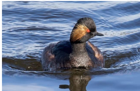
Geoorde fuut.

Hieronder twee artikelen uit De Grote Ratelaar van IVN Gooi en KNNV Gooi.