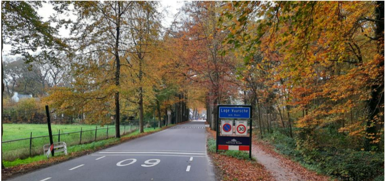
Lage Vuursche vanaf de Vuursesteeg richting Dorpsstraat gezien.