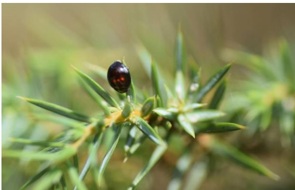
Heidelieveheersbeestje / Chilocorus bipustulatus

● Enkele dagen later, op 20 juni, doe ik bij een zoektocht in de avond een paar bijzondere ontdekkingen - nou ja, daar kom ik achteraf thuis achter. Allereerst de Oranje vlekpedaalmot. Dit microvlindertje is zo klein, dat het eerder op een stofje met een oranje streepje lijkt, dan op een vlinder.