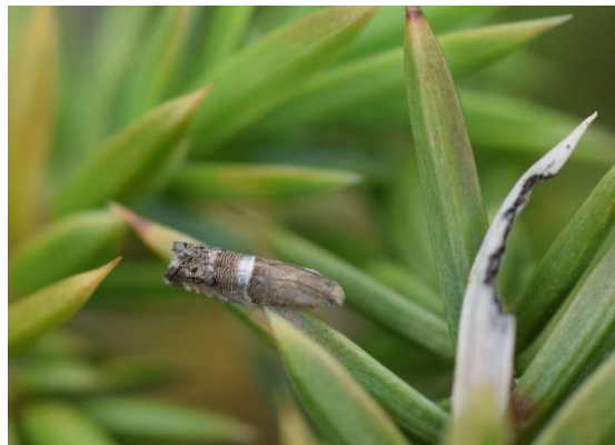
Jeneverbesdwergbladroller / Pammene juniperana

● Alsof het nog niet genoeg is, blijkt de prachtige geel/rode micro die ik zie rondvliegen het Kanariesmalsnuitje te zijn – nieuw voor de provincie. Ook het Zandkroeskopje mag er wezen.