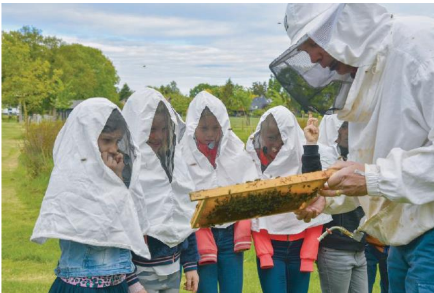
Bijenles op het Gagelgat in Soest. Zie de volgende bladzijde.