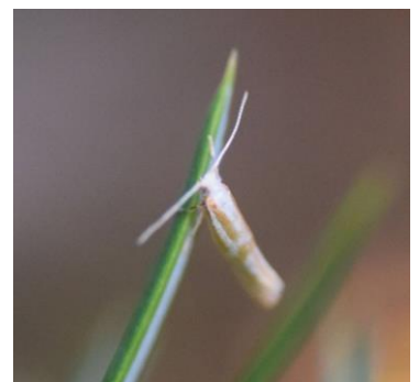
Oranje vlekpedaalmot / Argyresthia abdominalis

● Enkele dagen later, op 20 juni, doe ik bij een zoektocht in de avond een paar bijzondere ontdekkingen - nou ja, daar kom ik achteraf thuis achter. Allereerst de Oranje vlekpedaalmot. Dit microvlindertje is zo klein, dat het eerder op een stofje met een oranje streepje lijkt, dan op een vlinder.