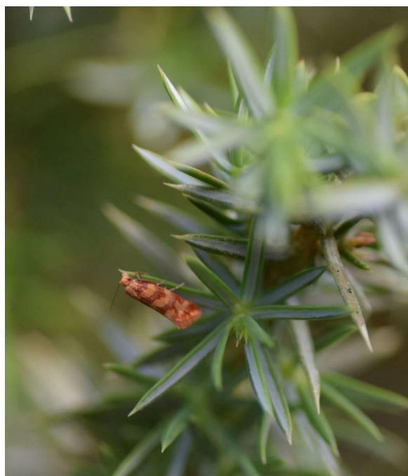
Kanariesmalsnuitje / Aethes rutilana