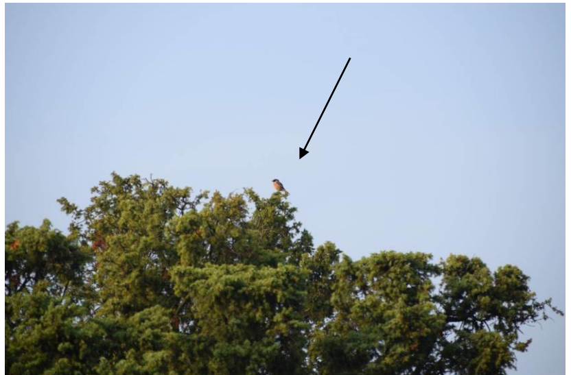
Roodborsttapuit ( Saxicola rubicola ) op een Jeneverbes

Heidelieveheersbeestjes, Jeneverbeskielwantsen en een enkele Cypresbodewants. Maar ook microvlinders, zoals de vrij grote Jeneverbesmot zijn te vinden, vooral 's avonds worden ze actief.