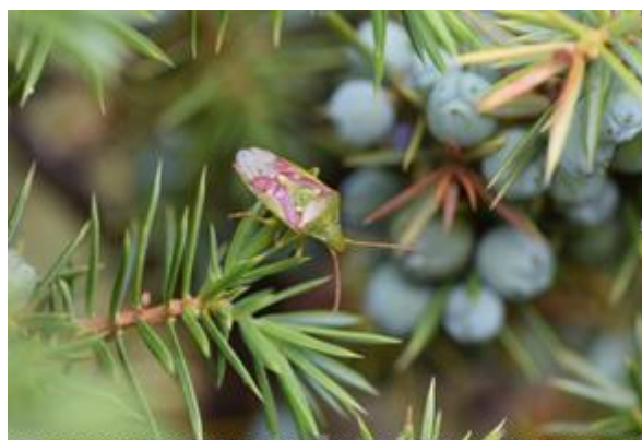
Jeneverbeskielwants / Cyphostethus tristriatus

Al met al bijzondere ontdekkingen, die aangeven hoe uniek deze jeneverbessen zijn, en waarom bescherming en instandhouding van de jeneverbes in Nederland 2 voor de biodiversiteit van niet te onderschatten belang is.