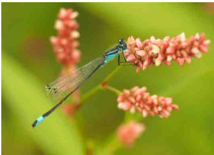
Lantaartje op perzikkruid

Ook kleine zonnedauw en moeraswolfsklauw treffen we hier aan. De wijde omgeving van het Knooppunt Eemnes is rijk aan vlinders.