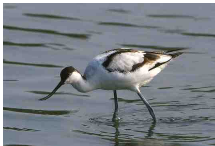
Kluut (vrouwje)