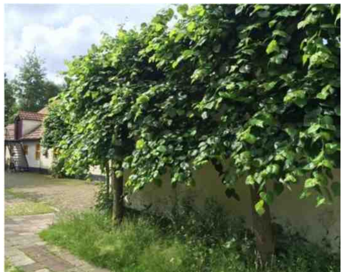
Winterlinde in lei-vorm bij Kinderboerderij/Duurzaamheidscentrum "De Veenweide" in Soest.

*Fotosynthese is het proces waarbij planten, onder invloed van zonlicht, water en koolstofdioxide omzetten in glucose en zuurstof. Beeldende uitleg o.a. https://m.youtube.com/watch?v=COPOANU6ksQ