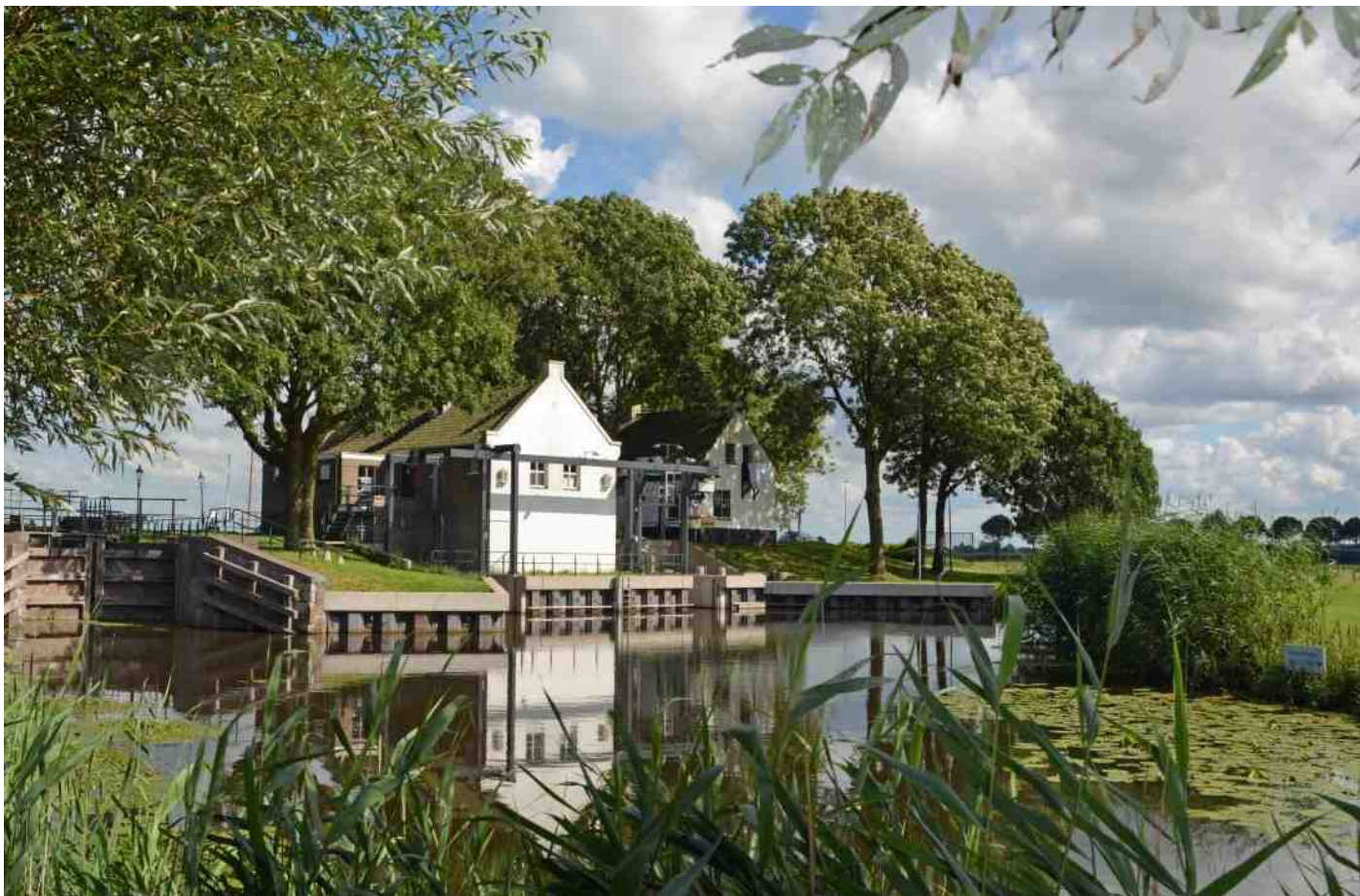
Gemaal Eemnes

van de polder droog houdt. Een idyllische plek omgeven door oude bomen waar al jaren een kolonie ringmussen broedt. Een prima stekje ook om eens over de Eemnesser Vaart terug te kijken naar Eemnes.