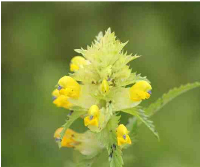
Grote Ratelaar