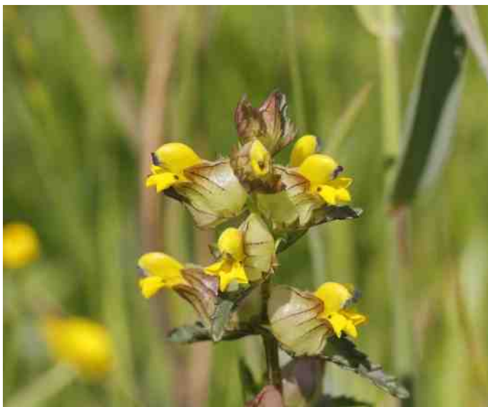
Kleine Ratelaar