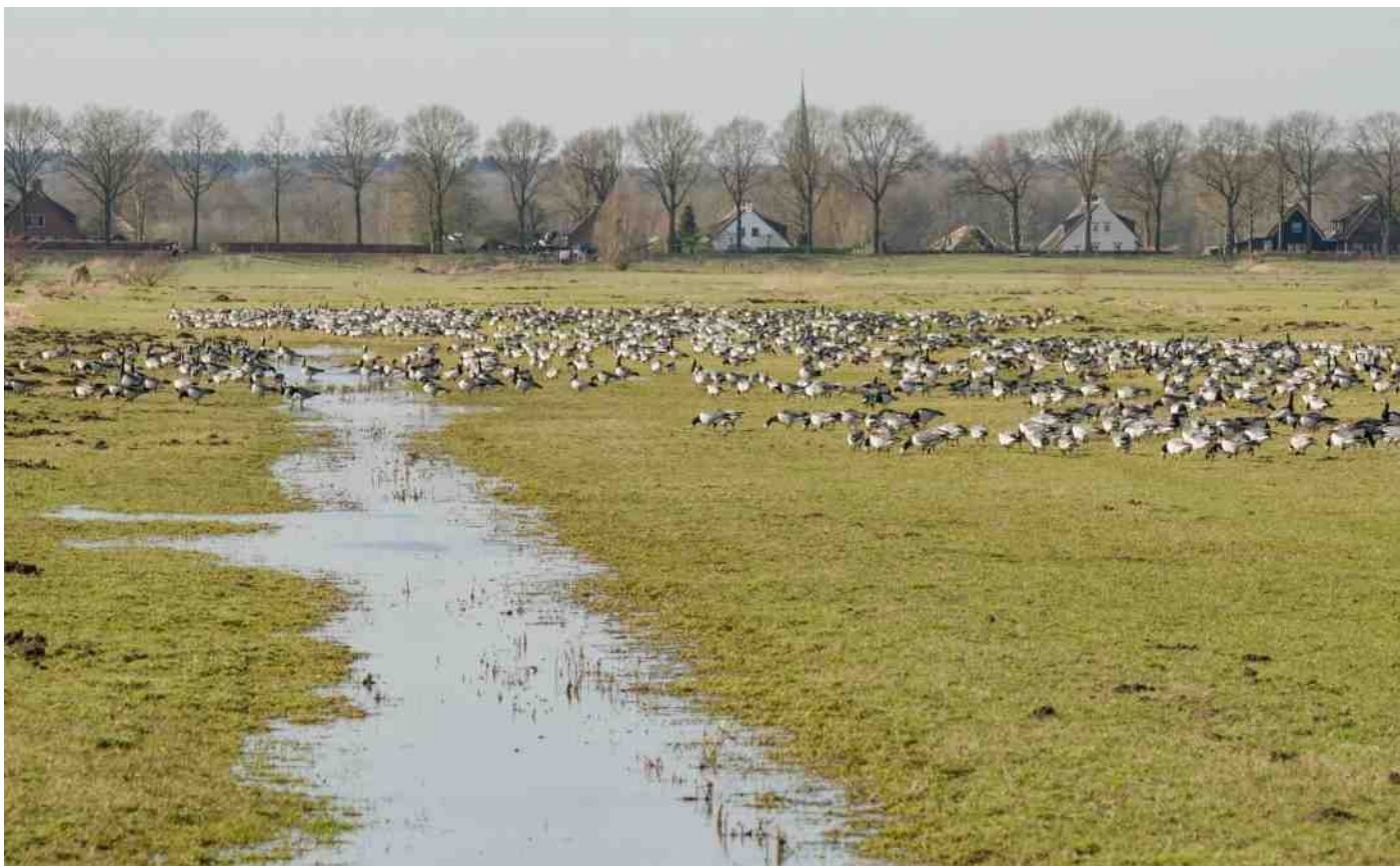
Plas-dras met brandganzen