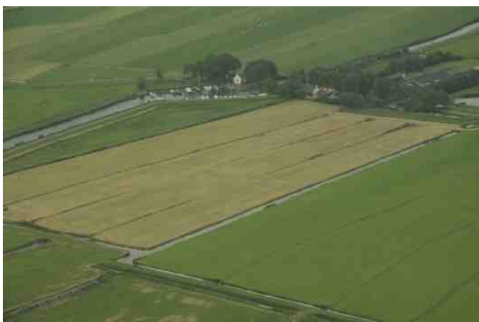
Het gemaal van boven

Rond 1900 waren hier baltsplaatsen op de dijk met tot wel 400 kemphanen (4). In de plasjes van de uiterwaarden zijn, naast andere weidevogels en ganzen, wel eens groepjes doortrekkende kemphanen te bespeuren. Nadat de soort als broedvogel helemaal was verdwenen komt de kemphaan tegenwoordig soms weer tot broeden in het noordelijk deel van de polder.