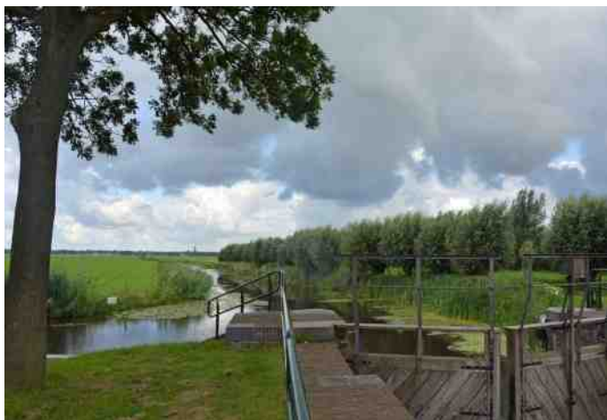
Eemnesser Vaart vanaf de sluis