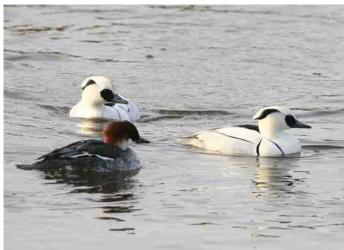
Nonnetjes - 2 mannen en 1 vrouw - foto: Wim Smeets