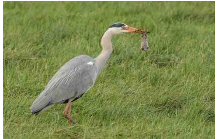
Blauwe reiger met aardmuis