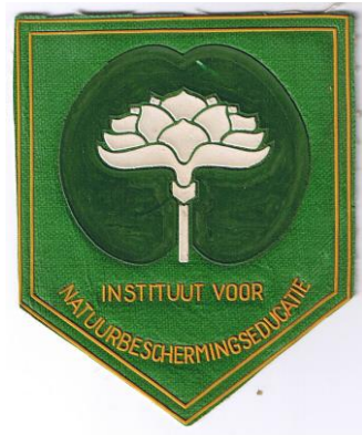
Het eerste IVN embleem