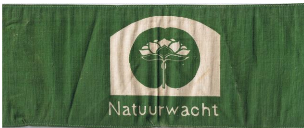
De armband van de natuurwachter