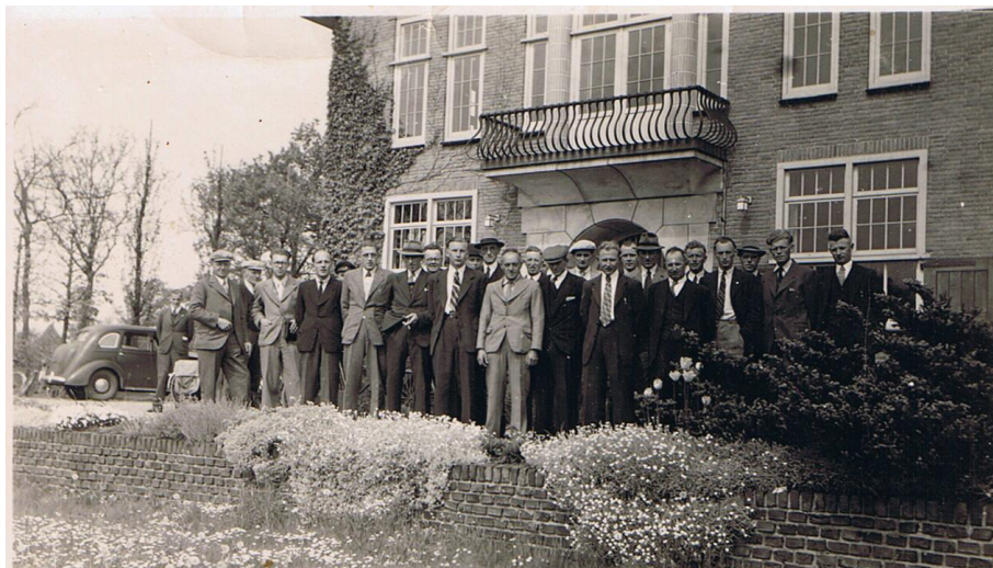
De oprichting van de Natuurbeschermingswacht Eelde De Natuurwacht telde in 1947 26 leden!