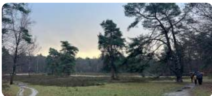
Over het Bennekomse Heitje

Zoals altijd startten we bij de slagboom aan het eind van de Hullenberglaan. Vandaar liepen we over een modderig pad door het bos.