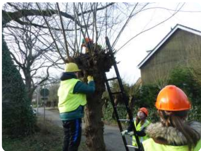
T'is best hard werken

Dus organiseerden we na een aantal jaren pauze met corona, slecht weer en geen geschikte bomen beschikbaar, weer onze knobweek. 87 leerlingen van groep 8 van De Plataan, de Wilhelminaschool en de Eben Haëzerschool hebben enthousiast en hard gewerkt en met elkaar 39 bomen geknot. Dat is meer dan een boom per groepje van drie leerlingen. Als je dan in de zon over het weggetje loopt en de kinderen enthousiast bezig ziet, lijkt het allemaal vanzelf te gaan. Het verzetten van de eerste dag vanwege storm en regen is snel weer vergeten, geen pleister geplakt. Alleen de vele hondendrollen zijn een