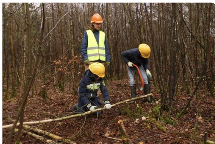
Aan het werk met de Bosvriendjes