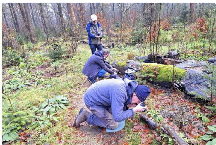
Zeven uitjes van de Florawerkgroep