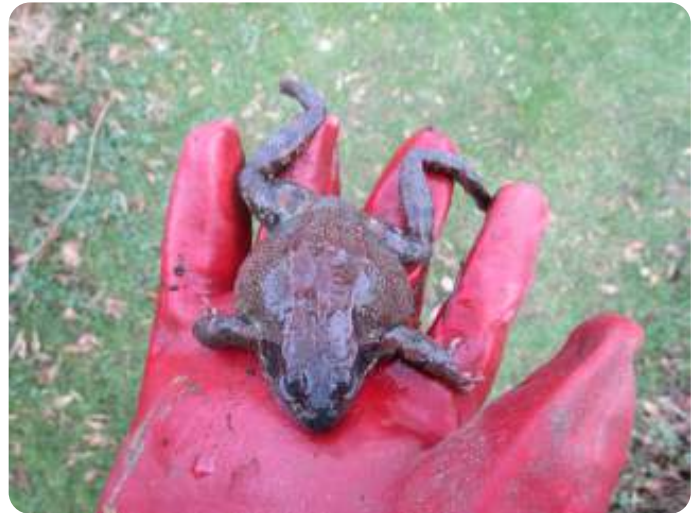
Verdronken onder het ijs

Nadat ik de dode kikkers naast elkaar op het gras had gelegd, bleef ik gehurkt bij ze wachten, alsof ze elk moment wakker konden worden, hoewel ik wist dat dat nooit zou gebeuren. Kikkers ademen onder water met hun huid, en de zuurstof onder het ijs was opgebraakt. Daardoor zijn ze