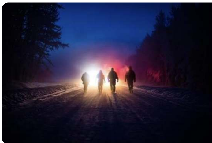
Op pad met de Natuurgidsen

Na overleg met het bestuur is aan Sonja van Kamer van Dsignkamer gevraagd een nieuwe layout voor ons Activiteitenprogramma te ontwerpen op A5 formaat. Door het grote aantal van 55 ingediende activiteiten voor 2024 is het zelfs een A5-drieluik geworden.