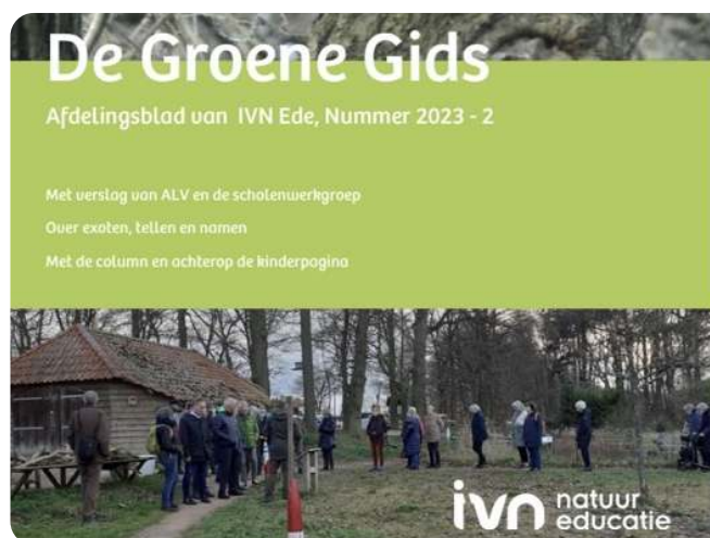
Vier Groene Gidsen