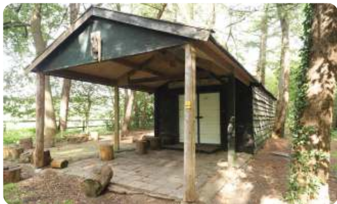
De schuur in Scherpenzeel

Echter midden in het bos staat ook een oude schuur. Deze prikkelde onze fantasie, we mogen de schuur gebruiken. Maar voor wat en hoe dan? Is er misschien een optie om iets te doen voor jeugd van 10 tot ca 15 jaar? In januari 2022 is onze eerste bijeenkomst: 'wat te doen met de schuur?' De schuur is er ooit neergezet voor een hondenclub en voor outdoor activiteiten en moest dringend worden opgeknapt. Hij staat op grond van de gemeente Scherpenzeel. Wat zegt het bestemmingsplan? Dat eerst uitzoeken. Er zijn mogelijkheden. We starten met het opstellen van een plan. Wat te denken van een 'escaperoom-achtig' spel.