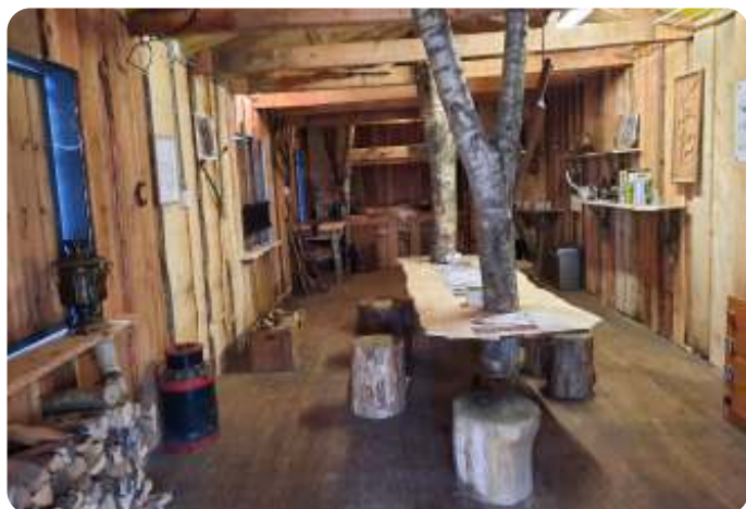
Het interieur, naar een vroeger boswachterswoning

De volgende stap is het maken van een begroting en het aanvragen van subsidie. Via de website van het landelijk IVN worden er suggesties gedaan bij wie en waar je een subsidie kunt aanvragen. Wij schrijven de gemeente Renswoude en de gemeente Scherpenzeel aan. Dat lukt de gevraagde subsidie wordt toegezegd. Van het Oranjefonds volgt een afwijzing. De RABObank en het waterschap zeg-