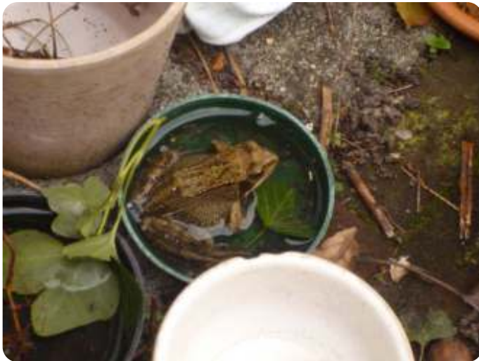
In een zelfgekozen mini kikkerpoel

In onze tuin hebben we een kleine vijver. De bruine kikkers vinden hem al jaren groot genoeg. En de tuin zelf heeft ze veel te bieden. Er staan bomen, veel struiken en her en der takkenhopen waar we aan blijven bouwen. Ze hebben genoeg schuilplekjes, en ze zijn inventief. Soms treffen we er eentje aan op een onverwachte plaats, zoals hier.