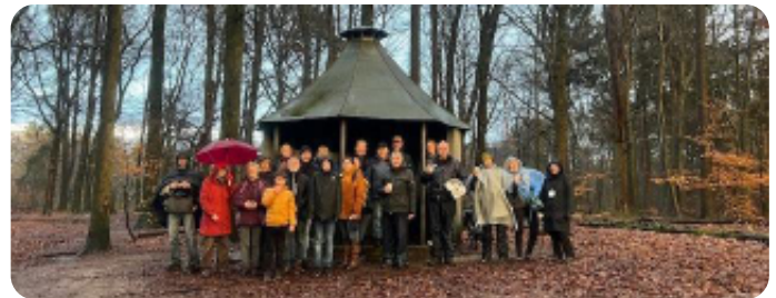
Groepsfoto bij het Koepeltje

Helaas bleef het maar regenen. Daarom liepen we een stuk over het fietspad langs de Prins Hendrikweg en besloten langs landgoed De Born terug te lopen naar het koepeltje op de Hullenberg.