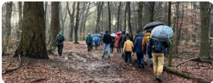
Op pad in de regen

Ondanks de regen waren er 26 deelnemers, waarvan ook enkele niet uit onze eigen regio. Zij hadden via de landelijke IVN-website gezocht naar een wandeling op 1 januari. Een van hen was Janny Koot uit Bleiswijk, die de bij dit verslag afgedrukte foto's maakte.