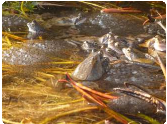
Kikkers in de lente

De volgende dag zoek ik nog één keer de bodem van de vijver af en haal tot mijn opluchting alleen slib naar boven. Geknield bij de rand zie ik iets bewegen in mijn