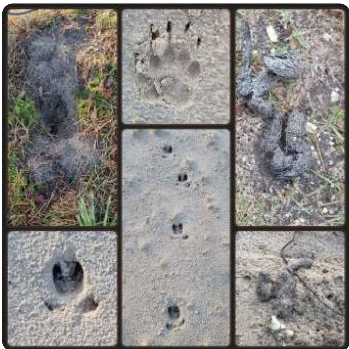
Onderweg vonden we drollen (vos, wolf?), middenboven pootafdruk van das, andere pootafdrukken wildzwijn, links boven latrine van de das

Er vond veel kruisbestuiving plaats bij de actieve aanwezigen, dank aan alle gidsen!