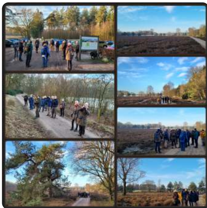
Start excursie met groep, eerste deel excursie, foto's rechts van collage, in weiland achter heideveld zagen we de meeste vogels

Naast veel vogels die gespot werden: grote groep kramsvogels, buizerd en houtsnip, vonden we ook veel diersporen, vos, wolf, wildzwijn, ree, das, haas, konijn en meer.