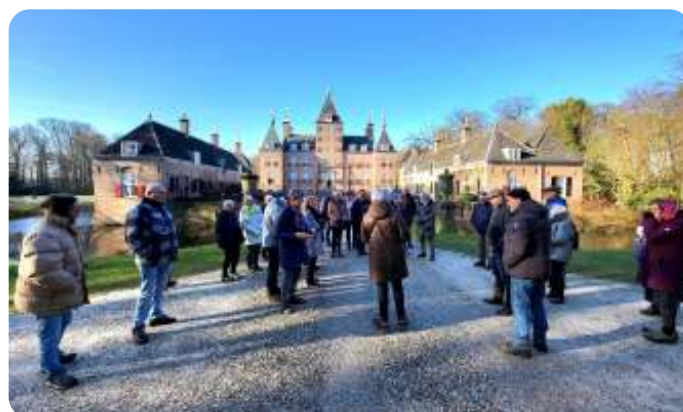
De groep voor het kasteel Renswoude

Natuurlijk wordt Renswoude niet voor niets kraaiendorp genoemd. De roeken zijn al bezig hun nesten op te knappen en laten zich luidkeels horen. Wat valt er veel te vertellen zelfs in de winter.