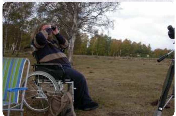
Sander vogels kijkend