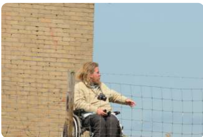
Sander op Texel