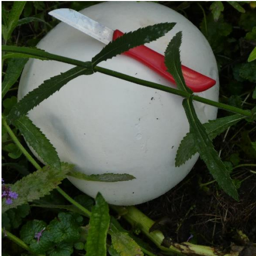
Reuzenbovist