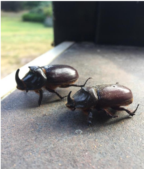
Neushoornkevers (dood)

Het actualiteitenprogramma voor 2022 staat op de website van IVN Ede. http://www.ivn.nl/afdeling/ivn-edede . Er zijn leuke activiteiten in 2022 te beleven. Ook in 2023 onder andere op 19 augustus 2023 wandelexcursie op Natuurgebied de Zanding. Op zaterdag 19 november 2023 een wandelexcursie over de geschiedenis van Planken Wambuis.