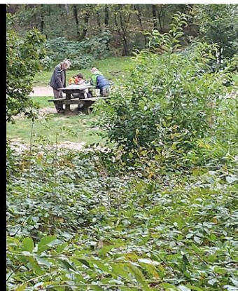
Wat heb je gevonden