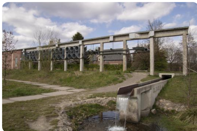
De muur met kunstnesten aan de Hartenseweg

Voor hoogvliegende prooien vallen ze door de donkere bovenkant minder op tegen de achtergrond van de grond. Voor laag vliegende insecten vallen ze door de lichte onderkant minder op tegen de achtergrond van de lucht. Huiszwaluwen leven van vliegende insecten, vooral muggen en vliegen, die ze behendig uit de lucht plukken. Kleine insecten worden volgens Piersma (2017) tot een soort gehaktballetjes samengeperst voor ze aan de jongen worden gevoerd. Maar ik zie dat grotere prooien niet altijd worden gedood voor ze aan de jongen worden gevoerd. De jongen hebben soms de grootste moeite de tegenstribbelende prooien naar binnen te krijgen (en te houden, want het slachtoffer weet soms weer naar buiten te kruipen). De huiszwaluw is in Nederland sinds de jaren 70 van de vorige eeuw tot aan het eind van de eeuw sterk achteruitgegaan. Daarna zijn ze begonnen weer gestaag toe te nemen, maar ze zijn nog lang niet weer op hun oude niveau terug. Vijftig jaar geleden waren er ongeveer 400.000 broedparen in Nederland, nu ongeveer 100.000. Sovon vroeg zich af hoe het herstel van de Huiszwaluw in Nederland gestimuleerd kan worden en riep daarom het jaar 2018 uit tot het Jaar van de huiszwaluw. In dat jaar