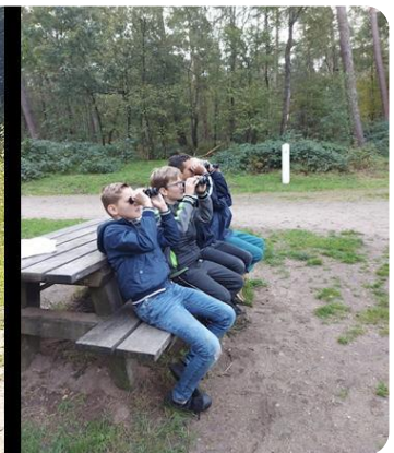
Speuren naar vogels