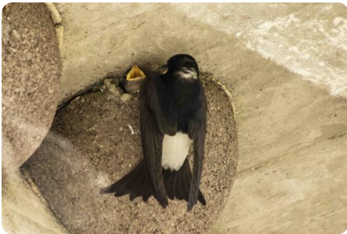
Huiszwaluw bezig met voeren van 1-2 weken oude kuikens, in kunstnest aan de Hartenseweg