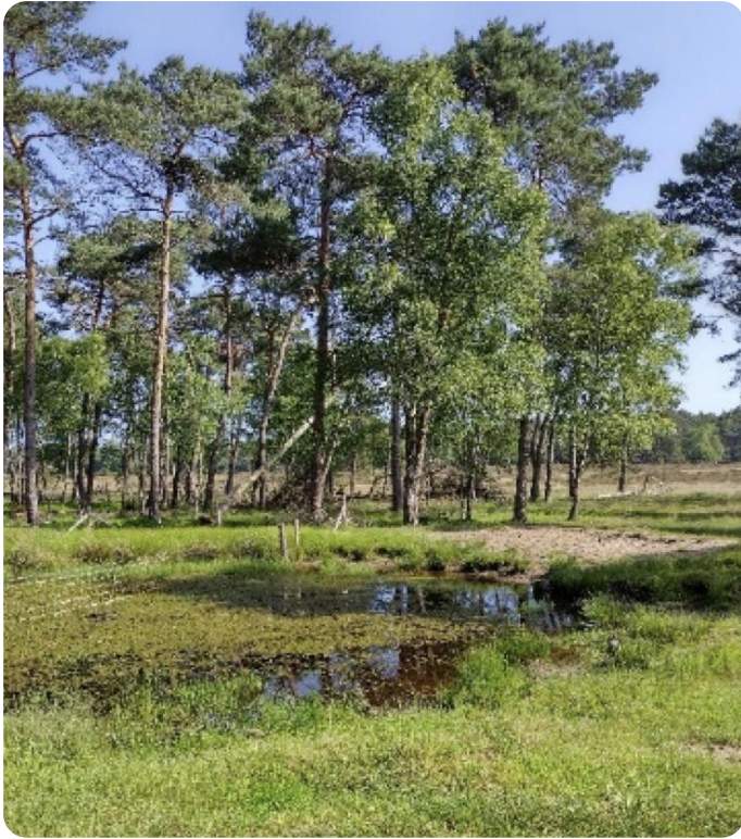
Ven Planken Wambuis