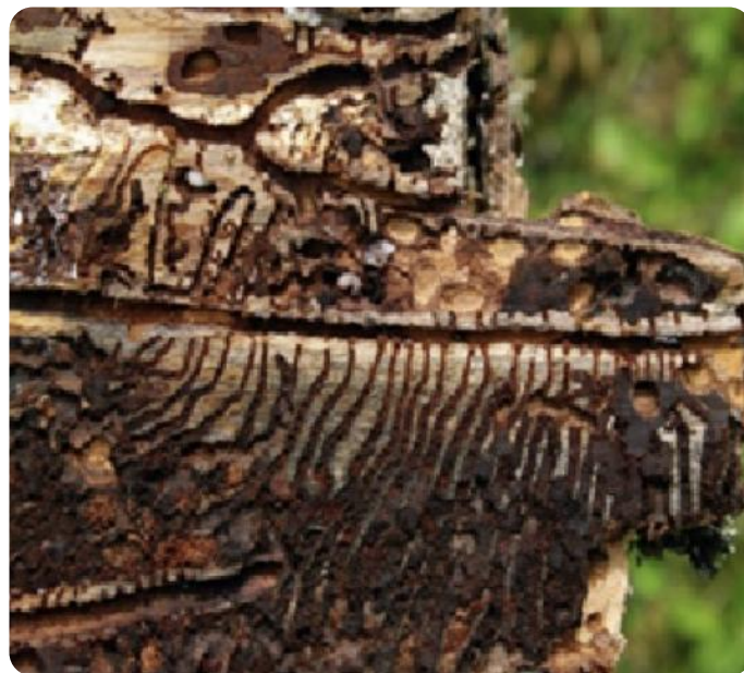
Gangetjes door de Letterzetter

De letterzetter heeft een voorkeur voor sparren en lariksen. Een mannelijke letterzetter zoekt een verzwakte boom op. Hij boort zich naar binnen en bouwt een 'paringskamer'; een gangetje van een centimeter of tien. Vervolgens scheidt hij een chemische stof (lokmiddel) uit om vrouwtjes te lokken. Een mannetje letterzetter paart met twee tot drie vrouwtjes tegelijk. Het vrouwtje legt de eitjes in de 'paringskamer'. De larven, die in deze gangetjes worden geboren, eten vanuit de hoofdgang nieuwe gangen en vormen zo patronen die (met enige fantasie) op letters lijken.