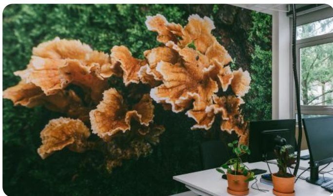
Behang in het regiokantoor IVN Gelderland met foto van Wim Müller