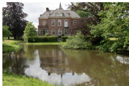
Landschapsfotografie Landgoed Hoekelum