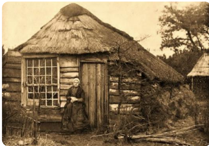
Het Zandvrouwtje Hent uit Zaand (1909)

Op 12 februari vond een oefenexcursie plaats op het Wekeromse Zand. Iedere cursist verzorgde vijf minuten. De ene cursist vertelde over het ontstaan van het landschap en een ander stond stil bij de laatste bewoonster van het Wekeromse Zand, de zevenentachtigjarige 'Hent uit Zaand'. De cursist deed dat door A.B. Wigman te citeren uit het tijdschrift Buiten (1910). Enkele andere gelukkigen onder ons zagen zelfs nog een das schuifelen tussen het struikgewas. Alle deelnemers hebben erg genoten van de