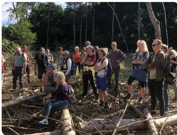
Luisteren naar het verhaal over de letterzetter op Planken Wambuis

Op Planken Wambuis werd het teamwork zichtbaar in de verschillende activiteiten. Zo stond op een gegeven moment de hele groep stil, met als doel om stil te lopen en al je zintuigen te gebruiken om de natuur waar te nemen. Een ander groepje stelde quizvragen of vertelde een verhaal.