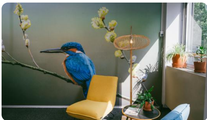
Behang in het Regiokantoor IVN Gelderland met foto van Fred van Wijk

Zie de Flickr site met foto's van de werkgroepleden: https://www.flickr.com/photos/wgfotografie_ivnede/