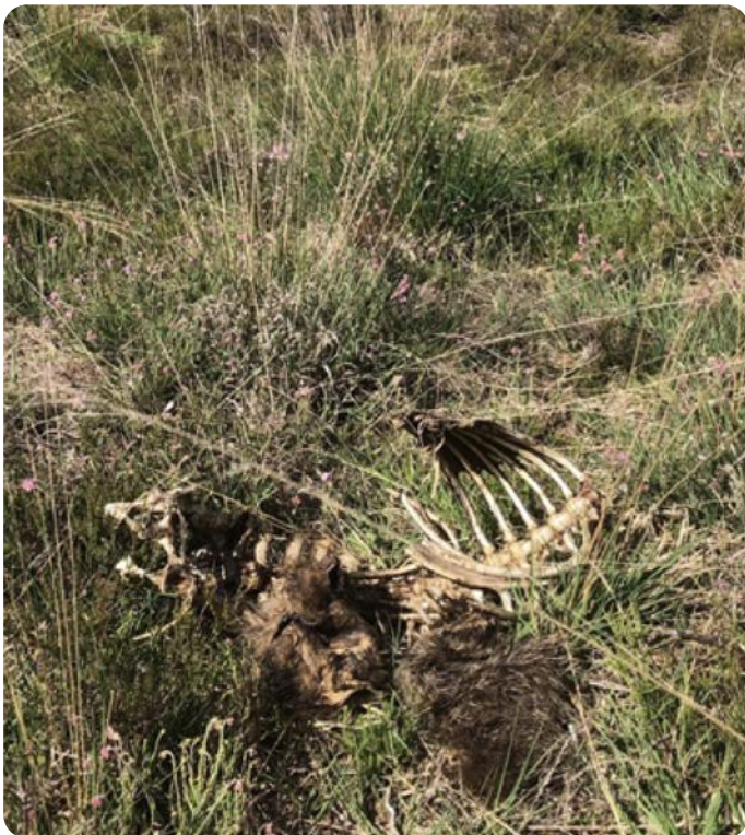
Karkas van wild zwijn gevonden tijdens het voorlopen op Planken Wambuis