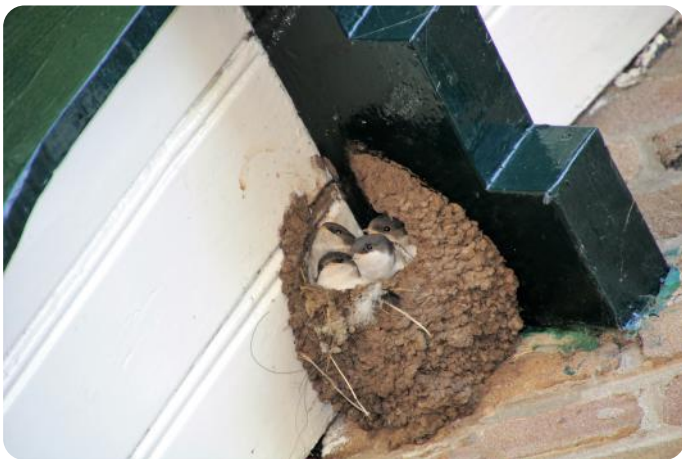
Bijna volgroeide Huiszwaluwkuikens in hun geleidelijk afbrokkelend nest (Noord-Ginkel)

Voor hoogvliegende prooien vallen ze door de donkere bovenkant minder op tegen de achtergrond van de grond. Voor laag vliegende insecten vallen ze door de lichte onderkant minder op tegen de achtergrond van de lucht. Huiszwaluwen leven van vliegende insecten, vooral muggen en vliegen, die ze behendig uit de lucht plukken. Kleine insecten worden volgens Piersma (2017) tot een soort gehaktballetjes samengeperst voor ze aan de jongen worden gevoerd. Maar ik zie dat grotere prooien niet altijd worden gedood voor ze aan de jongen worden gevoerd. De jongen hebben soms de grootste moeite de tegenstribbelende prooien naar binnen te krijgen (en te houden, want het slachtoffer weet soms weer naar buiten te kruipen). De huiszwaluw is in Nederland sinds de jaren 70 van de vorige eeuw tot aan het eind van de eeuw sterk achteruitgegaan. Daarna zijn ze begonnen weer gestaag toe te nemen, maar ze zijn nog lang niet weer op hun oude niveau terug. Vijftig jaar geleden waren er ongeveer 400.000 broedparen in Nederland, nu ongeveer 100.000. Sovon vroeg zich af hoe het herstel van de Huiszwaluw in Nederland gestimuleerd kan worden en riep daarom het jaar 2018 uit tot het Jaar van de huiszwaluw. In dat jaar