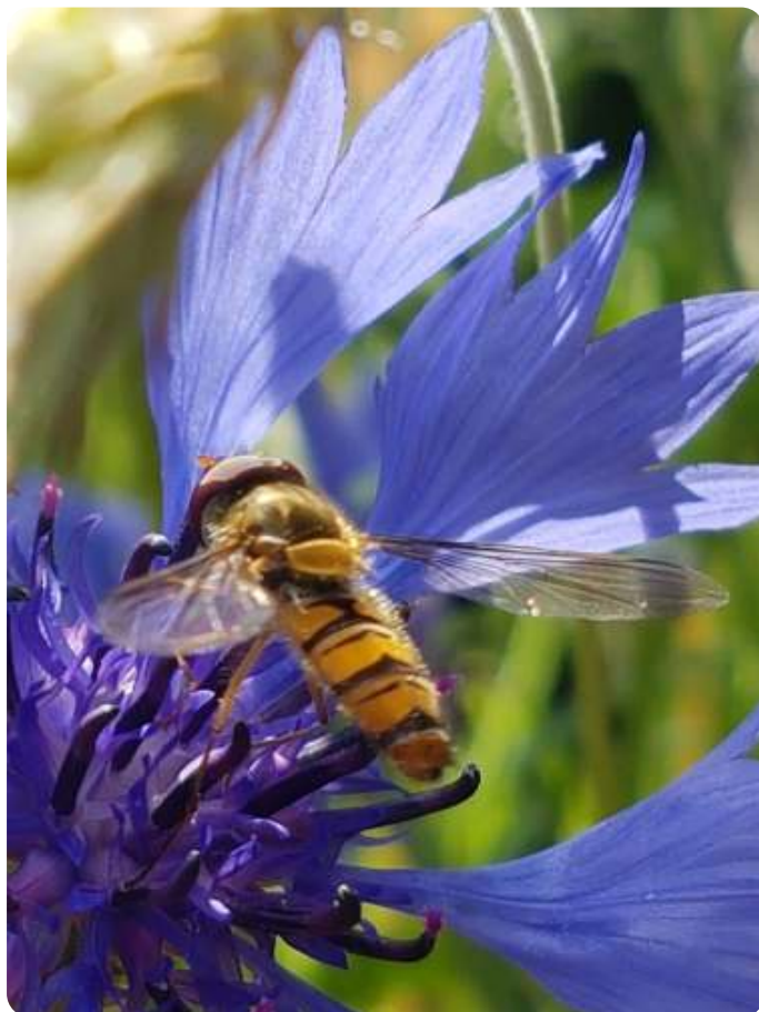
snorzweefvlieg

Aan de noordwestkant van Pijnacker ligt de Polder van Biesland en in dit gebied ligt een klein, relatief jong en heel aardig natuurgebied: het Krekengebied. Dit is een gebied dat uit verschillende biotopen bestaat: o.a. bos, waterpartijen, rietvelden, moeras en weide. Hierdoor is er een grote variatie in vegetatie en dierenleven. Tijdens deze wandelexcursie (ca. 3 km lang) gaan we op zoek naar allerlei leuke planten en naar vroeg in de ochtend zingende vogels, waarbij we ons voor een groot deel op het gehoor moeten oriënteren, want het valt in dit gebied niet altijd mee om de kleine vo-