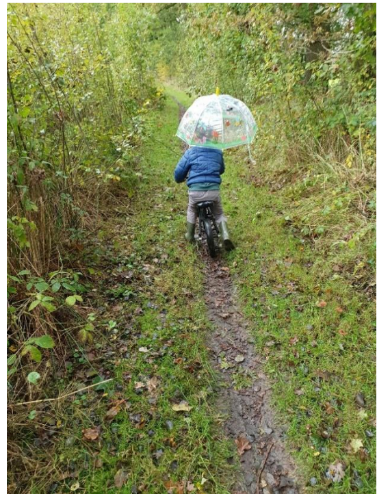
De jongste deelnemer