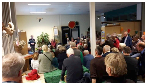
Lezing voor 80 bezoekers over bodemdaling in de regio

Er is een tweedehands laptop gedoneerd voor de lezingenavonden. Dit is erg prettig want daardoor is er minder gedoe met het aansluiten op de beamer en hoeven de leden van de werkgroep niet meer hun eigen laptop uit te lenen.