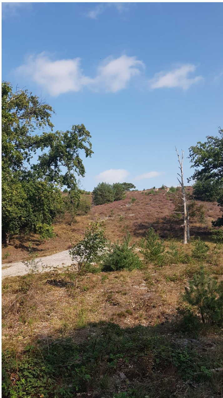
Herfst op de Brunsummerheide