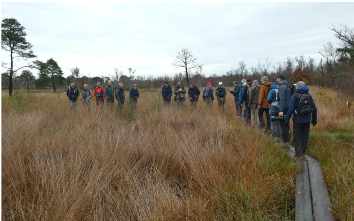
Ledenexcursie in het Wooldse Veen