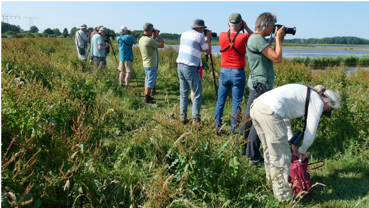
Kijken naar de vele steltkluten, Osbroeken bij Zuidlaren

Het excursieprogramma voor 2024 staat inmiddels al weer op de website!