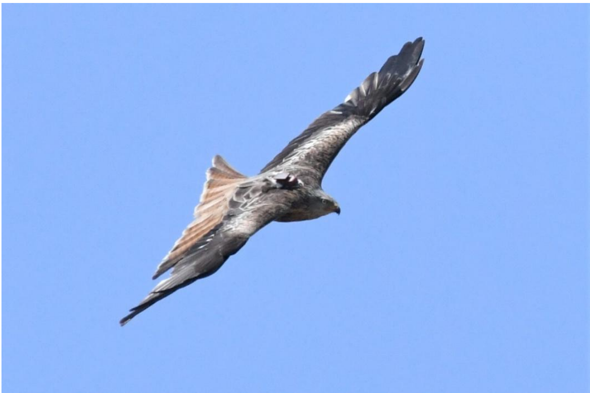
Rode wouw met zender op de rug

Slaaplaatsstelling ; bij de Slondeplas in Eldrik wordt door Gerbert het aantal grote zilverreigers geteld op een slaapplaats aldaar in de wintermaanden. Er is 2x geteld met een maximum van 18 vogels.