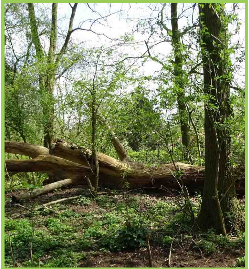
Netwerken in park Overstegen zie blz. 13