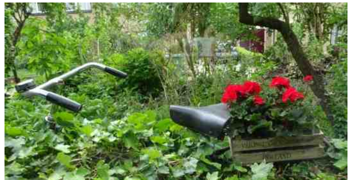
Even naar de veiling geweest...