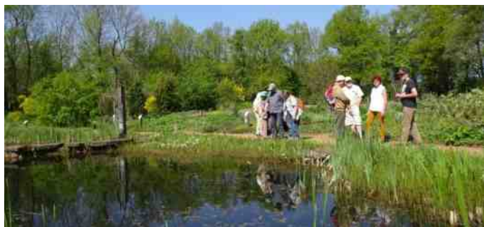
Kruidenhof te Mallum

Wij genoten van deze excursie. Een aanrader om ook eens heen te gaan. De tuin ligt aan de Molenweg, vlak naast de Mallumse Molen.