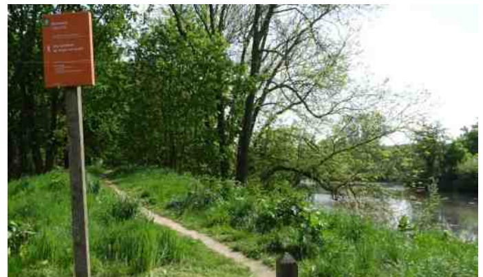
Toegang IJsselvlei Lage Linie, Doesburg