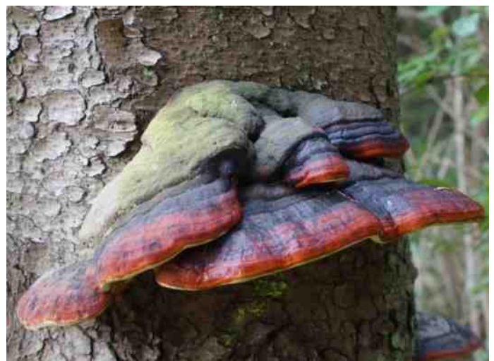
Roodgerande houzwam; genomen in Hunsrück Jan Kuiperij