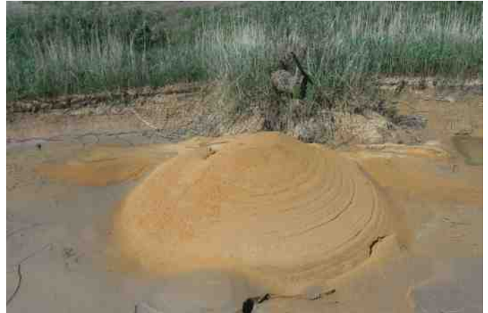
Mierenhoop (?) bij steenfabriek in Pannerden. Mark Derks

Wie heeft er ook een bijzondere natuurwaarneming? Maak er een foto van en stuur deze, liefst met een korte toelichting, naar de redactie.