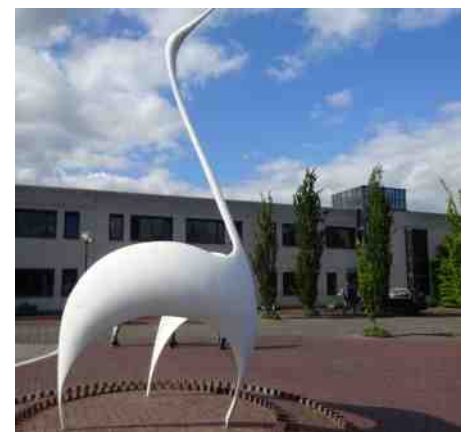
17.30 u. Mini-symposium (gesprekken over de doelstellingen van een geopark) in het gemeentehuis in Gendringen.