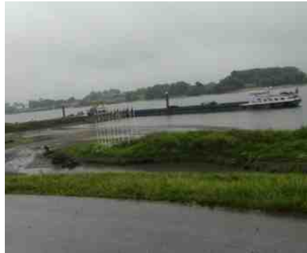
Tolkamer, aan de Rijn