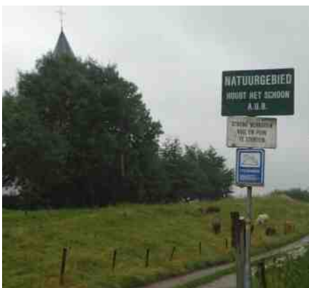
Oud Zevenaar. De oudste dijk