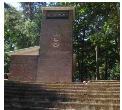
Engbergen, openlucht theater