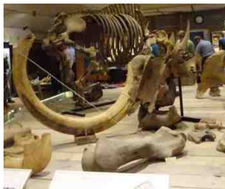
12.00 u. In bezoekerscentrum Min40Celcius in Varsselder. René van Uum geeft een toelichting.