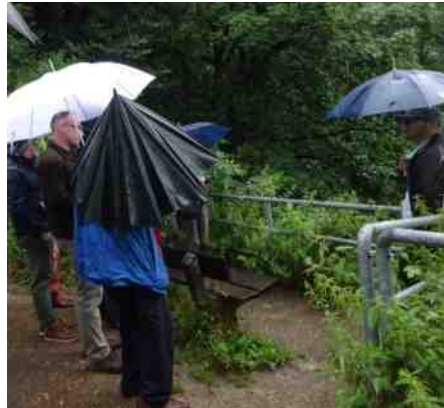
Uitzicht op een hoge stuwwal in Hoog Elten. Het regent nog steeds.