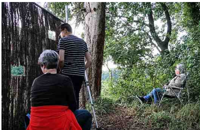
Achter het kijkscherm

Onderweg werden we verrast door hazen en drie reeën, waaronder een pikzwart exemplaar! De baron van Hackfort heeft tijdens zijn leven beslist dat de zwarte reeën op zijn landgoed gespaard moesten worden tijdens jachtpartijen. Zodoende lopen er nu altijd nog zwarte reeën in het gebied rond.