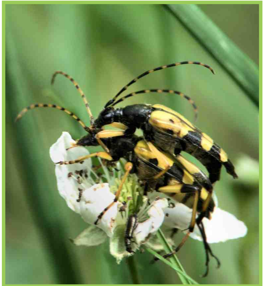
Parende gevlekte smalboktorren