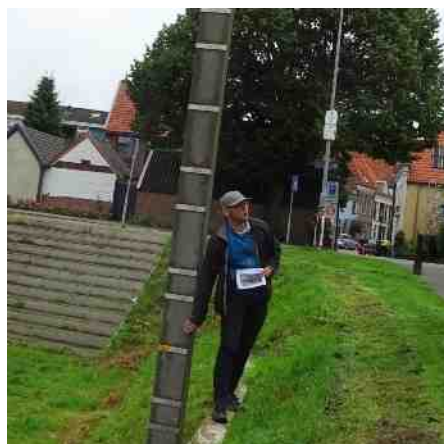
Doesburg. Meetpaal waterstand in de lopp van de geschiedenis