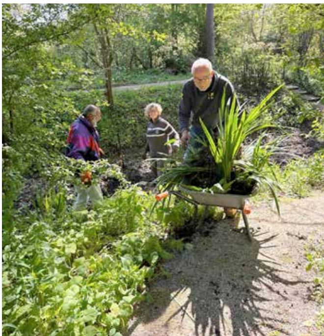
Vrijwilligers aan het werk

Drie bijzondere soorten die je langs de IJssel en in de heemtuin kunt aantreffen zijn heggenrank, besanjelier en weidegeelster. Heggenrank heeft een specifieke bezoeker, de heggenrankbij. Deze bij verzamelt stuifmeel op de mannelijke planten (heggenrank is tweehuizig) waarmee het nestje voorzien wordt van voedsel. Later zullen de groei-