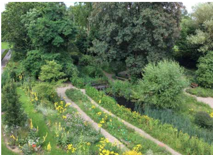
De heemtuin vanaf het aangrenzende verzorgingshuis