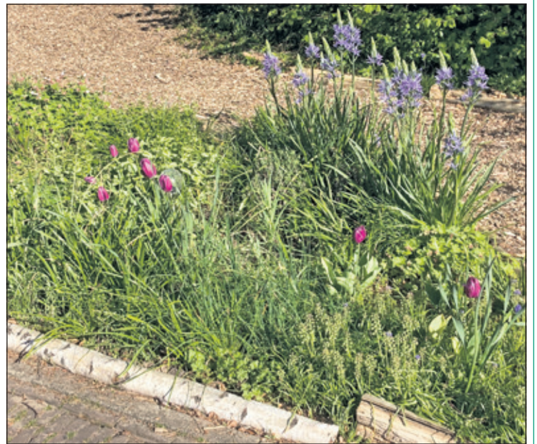
Deze foto van het gemeenteperk op de hoek van de Acacialaan/Iepenlaan laat het stukje groen zien, dat geadopteerd is door de daar wonende inwoners en geeft een indruk hoe je kleur kunt brengen in je directe woonomgeving. (Wim Kreuger; Bilthoven)