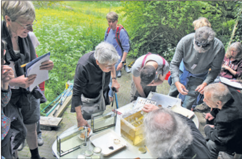
Een watersafari: ontdek in anderhalf uur wat er leeft in het water: vang en zoek.

Nadat alles was bekeken werd de vangst weer teruggezet. De kleine snoek was wel het bewijs dat het daar goed gaat. Als deze soort zich