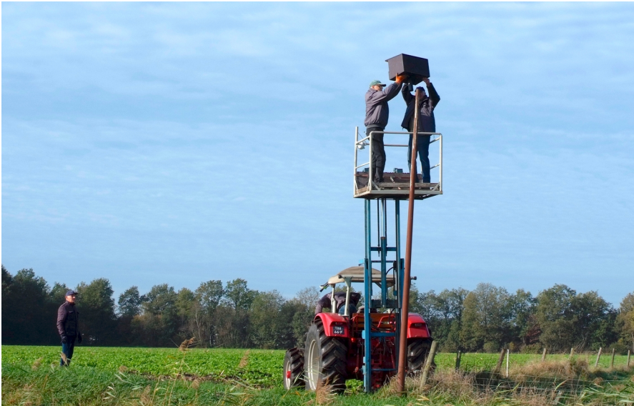
Torenvalkkast wordt geplaatst, Foto: Marlie Rijkers en Tonnie Hegge

en machines. Geen probleem; we roepen wat sterke mannen van de werkgroep op, graven de paal eruit en verplaatsen deze. Peter had al een locatie in gedachte langs de Bulder Aa dicht bij een grote eikenboom zodat hij geen problemen zou hebben met het werken op het land. Wel anderhalve meter van de rivierkant afblijven vanwege het gebied van Waterschap 'De Dommel'. Peter belt een dag later terug: "Ik kom wel even met de verreiker, haal de paal eruit en laat deze weer wel in het gat zakken dat jullie gegraven hebben, dat is zo gebeurd, stelt niks voor!".