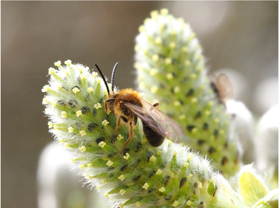
Zandbij op stekelbrem

Op een, op 1 april verregende dag, was er de eerste heidewandeling van de Heidecursus, waarbij we wel het geluk hadden dat het tijdens de wandeling vrijwel droog was. Maar van alle kleine beestjes was niks te zien, die zaten te chillen in hun nestjes, lekker droog onder de grond.