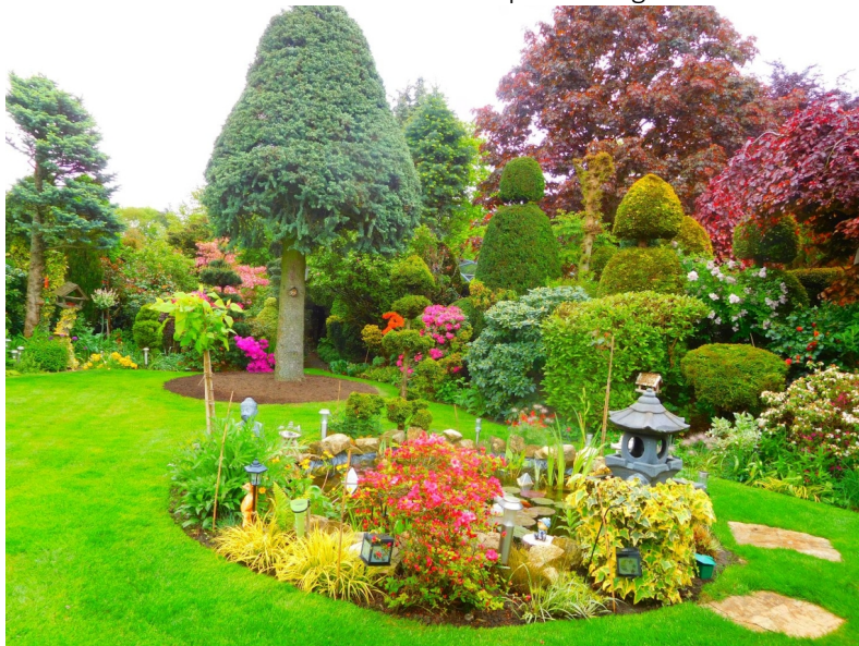
Tuin van Toon van Seggelen

Toon van Seggelen zal op 26 april een lezing geven over zijn eigen tuin. In de loop der jaren heeft hij vele foto's gemaakt van zijn tuin, waarin een grote diversiteit van planten en bloemen staan. Verder heeft hij verscheidene soorten vlinders en andere insecten op de foto gezet.