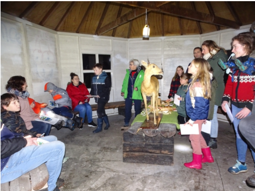
Uitleg over de dieren in de tent

Toen de eerste personen zich kwamen aanmelden, begon het jammer genoeg te motregen. Dit mocht de pret van de kinderen niet drukken en zij volgden de verlichte route met goede moed. Zo konden ze de spiegel van een ree ontdekken, de omvang van een wolf zien en het geluid ervan horen, vuurlichtjes ontdekken, zelf door een mollen-gang kruipen, en de uilen horen en zien. Ook waren het wilde varken, het hol van de das en de das zelf te zien. Met een nachtkijker konden ze dieren ontdekken.