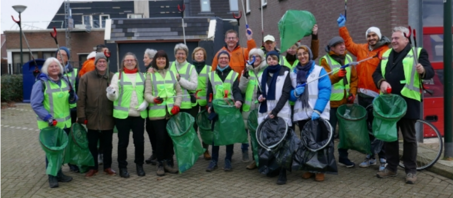
ZAP- GROEP DE VROLIJKE RAPERS

Rond 12.00 uur kwamen zij weer samen bij Kikker. Score: ruim 20 vuilniszakken zwerfafval! De koffie was dus welverdiend. Naast het rapen van afval, is de sociale binding van zo'n dag ook heel belangrijk. Heel mooi om te zien was ook de interactie tussen de mensen van het AZC en de Vrolijke Rapers. Heeft u interesse om mee te doen of wilt u wat meer over ons weten, stuur dan een mail naar d.wijbrandi@gmail.com .