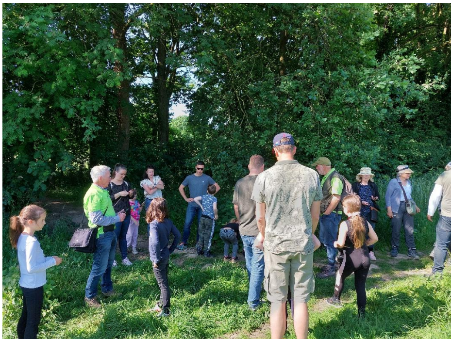
Insectenfotosafari, 04-06-2023 Schwienswei

De IVN-missie: het IVN laat je leren van de natuur en verrijkt daarmee je leven. Het laat je nadenken over je gedrag en motiveert je tot milieubewust handelen.