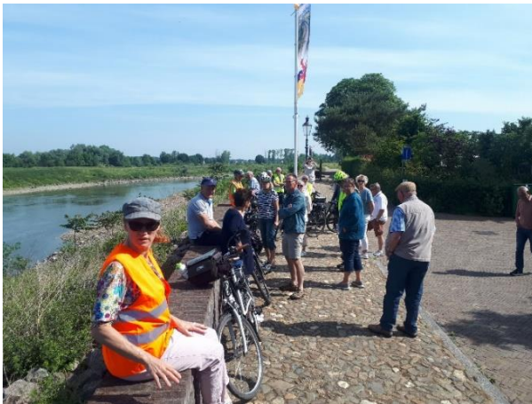
Mooie vergezichten langs de Maas

Thema was dit jaar “Langs Maasdorpen tot Meers”; de route leidde ons vanaf Born naar Greatheide, Nattenhoven, Berg aan de Maas, Oud-Urmond, dan verder in zuidelijke richting langs de Ur naar Maasband, Meers, Kleine Meers en via de brug naar de overzijde van het Julianakanaal; daar pauzeerden we op het ruime terras van Brouwerij De Fontein in Oud Stein. We genoten van het gezellig samenzijn én van de prima koffie en de verse vlaai.