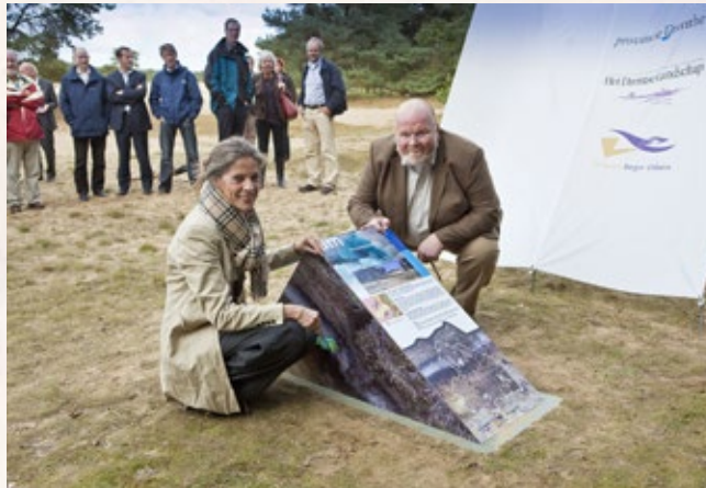
Onthulling eerste aardkundige monument Het Drouwenerzand