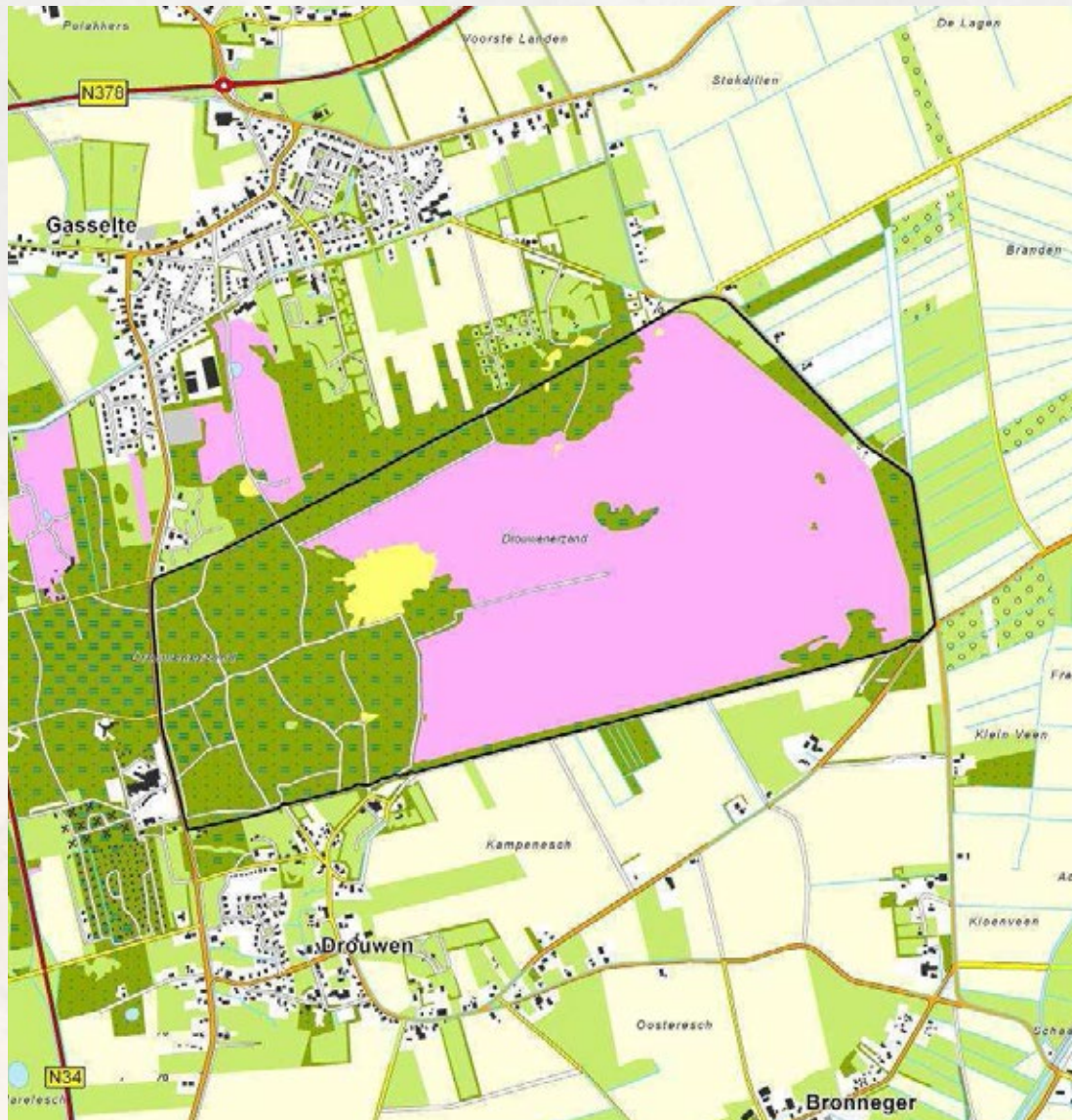
Kaart Natura 2000 gebied Drouwenerzand