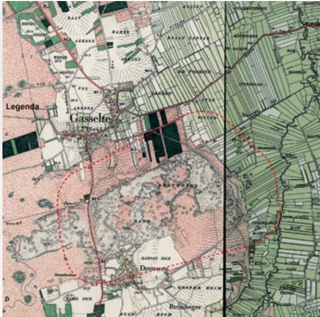
Situatiekaart Drouwenerzand rond 1900