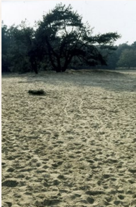
Sporen in het zand

De hoge recreatieve druk heeft als positief effect dat dit terreingedeelte nauwelijks kans krijgt om begroeid te raken, waardoor het stuifzand nog enigszins als zodanig herkenbaar blijft. De verwijdering van een groep bomen aan de oostzijde heeft tot gevolg gehad dat het open stuifzand zich de laatste tijd weer uitbreidt.