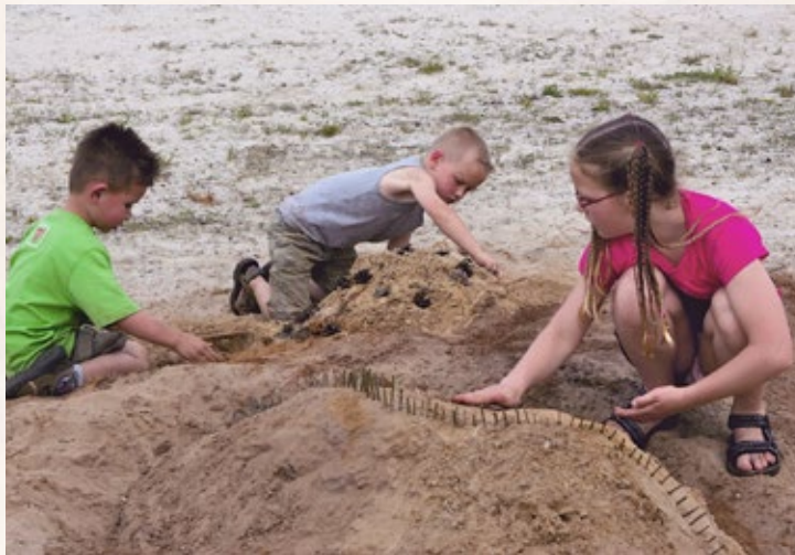
Schoolreisje naar Drouwenerzand