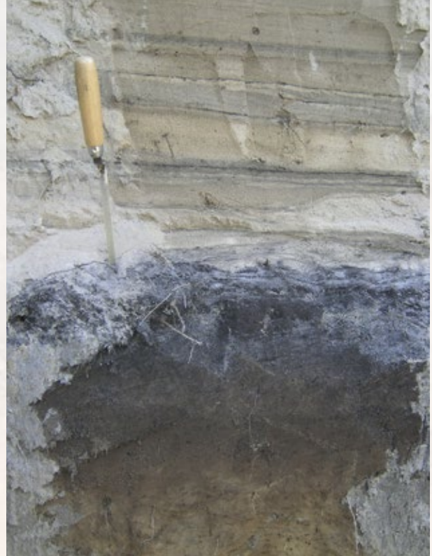
Stuifzand op podzolprofiel