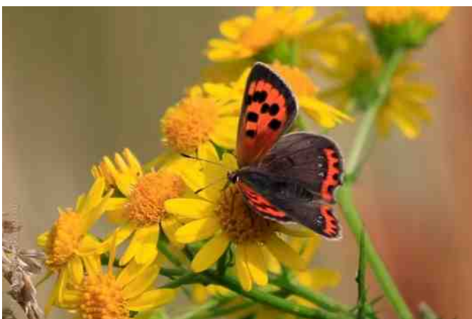
Kleine vuurvlinder in de Idylle.