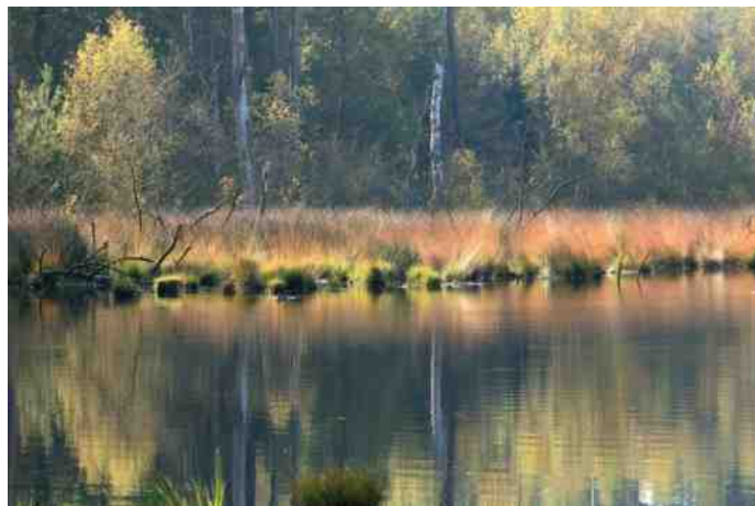
Bossen (fotografie Jos Vink).

De naaldbossen in onze omgeving bestaan vooral uit Fijnspar, Douglas en Sitkaspar. Ook in deze bossen werden allerlei hulpsoorten toegepast. De fijnspar doet het goed in Drenthe.