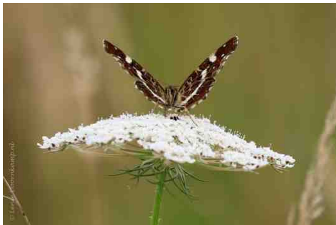
Landkaartje in de Idylle.

En uiteraard houden we via de website iedereen op de hoogte. Het is de bedoeling dat niet alleen bijen en vlinders, maar ook de mensen genieten van onze idylle.