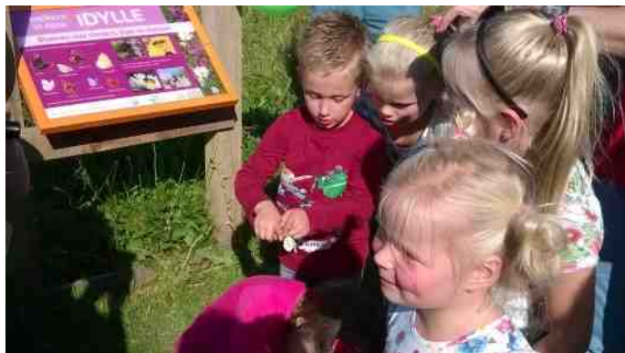
Opening van de Idylle.

Het toen nog nieuwbakken bestuur van de IVN-afdeling Borger-Odoorn heeft zich samen met het Hunebedcentrum aangemeld voor het project. Op 8 oktober 2013 werd onze idylle ingezaaid door Groenvoorziening A.J. van der Werf B. V.. Dit bedrijf zorgde daarna nog drie jaar voor het beheer (met hulp van vrijwilligers van onze IVN-afdeling).