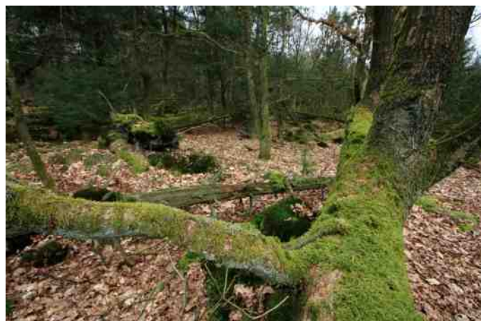
Dood hout leeft

Met name in de boswachterij Exloo-Odoorn hield de storm huis. Hele bospercelen werden geveld. Toen een ramp nu een zegen. Met name door de stormen veranderde het denken over bosbouw. Sindsdien hoor je de kreet: dood hout leeft!