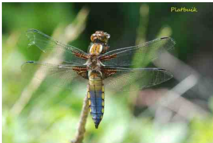
Platbuik (mannetje).

Als werkgroep beleven we veel plezier aan onze struintochten. Als u de Mandelanden wilt bezoeken onder onze begeleiding. Dit kan op 16 september!