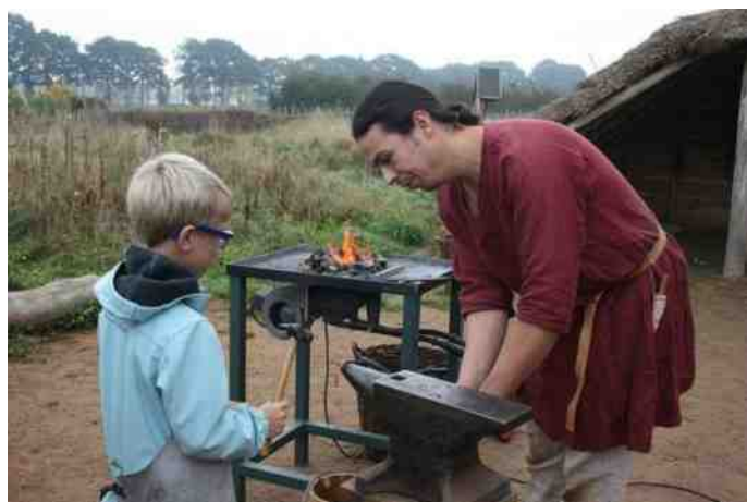
Hondsrugkids leren oude ambachten

Elke maand zullen de kinderen via een activiteit kennismaken met hun leefomgeving, wetenschap en beweging. De ene keer zullen de kinderen op locatie de activiteit ervaren, maar in de vakanties zullen de kinderen in de natuur of bij het Hunebedcentrum deelnemen aan de activiteit.