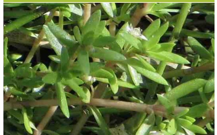
Watercrassula Valthe.

Watercrassula is op dit moment geconstateerd in enkele poelen en sloten rondom Valthe en zeer waarschijnlijk ook in één poel in het Molenveld bij Exloo. Vergroot als ware natuurliefhebber het probleem niet door bij een bezoek aan de waterkant stukjes Watercrassula aan de laarzen mee te nemen. Controleer je schoeisel op meelifers.