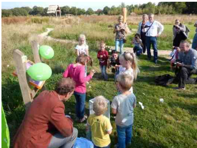
Natuureducatie bij de Idylle.