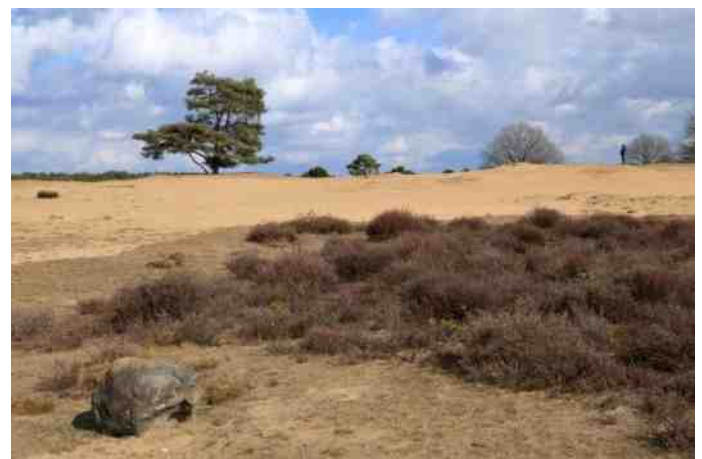
Drouwenerzand, aardkundig monument.