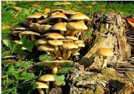
paddenstoelen op een boomstronk

In 2023 hebben we een tiental determineeravonden gehad. Met behulp van de veldgids Nederlandse Flora ( de "Eggelte") proberen we een aantal onbekende ( voor sommigen) planten op naam te brengen.