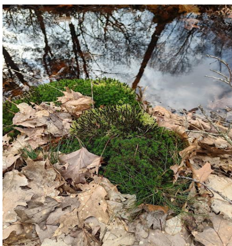
Landgoed Heerenbeek.