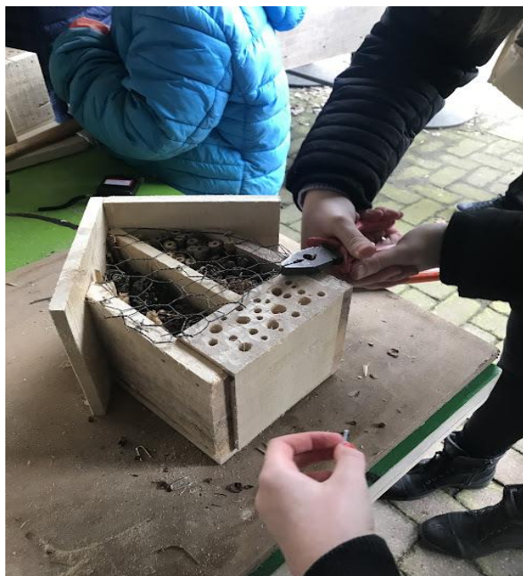
Insectenhotel timmeren