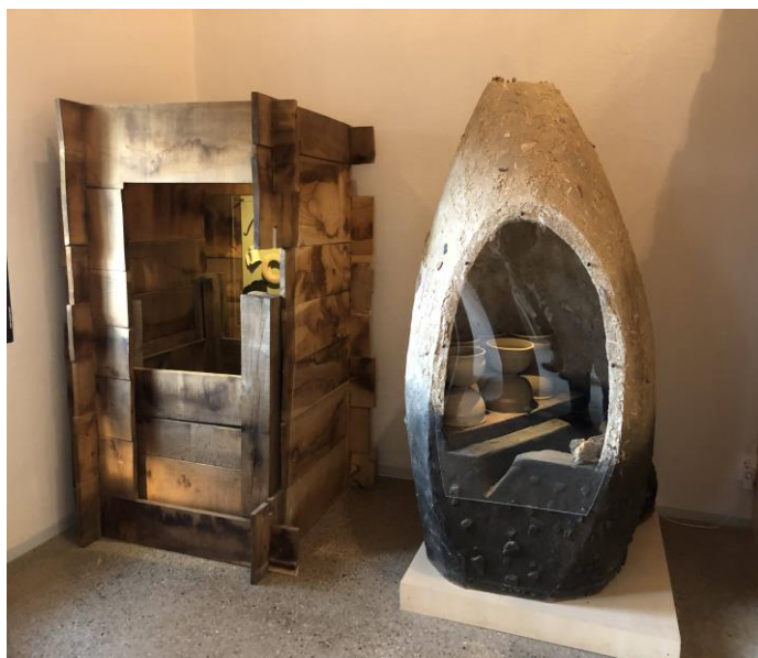
Bezoek Museum Romeins Halder