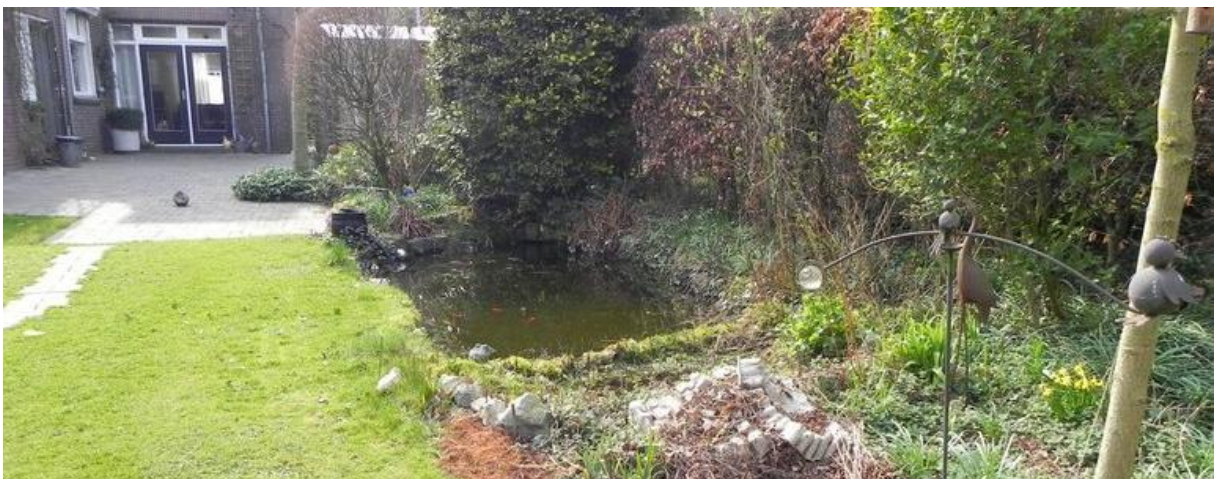
Tuinvijver waar dwergvleermuizen komen drinken

Nederlandse vleermuissoorten eten insecten. Insecten zijn afhankelijk van planten. Een ruime diversiteit aan planten en bomen in de tuin zorgt voor insecten als voedselbron. Idealiter zijn planten die in het actieve seizoen voor vleermuizen (grotendeels van maart tot november) bloeien, zodat insecten altijd voedsel vinden en vleermuizen de insecten. Inheemse wilde planten die in de nacht bloeien (zoals wilde kamperfoelie) geven nog meer kansen voor vleermuizen. Dan zijn insecten namelijk ook 's nachts actief zijn, in plaats van vooral tot in de late schemering of vanaf vroege ochtenduren. Een kleine vijver en moeraszone trekt insecten aan, en zorgt ook voor drinkwater. Wist je dat vleermuizen vliegend drinken? Daarom is een langwerpige vijver handig, als een soort landingsbaan. Daarnaast zorgt een composthoop of een takkenwal voor een ideale biotoop voor insecten en bodemdierpjes. Gebruik van chemicaliën in de tuin kan ertoe leiden dat niet alleen insecten vergiftigd raken, maar chemicaliën ook terecht komen bij grotere zoogdieren zoals vleermuizen. Daarom is het belangrijk om geen chemicaliën zoals pesticiden of insecticiden te gebruiken.