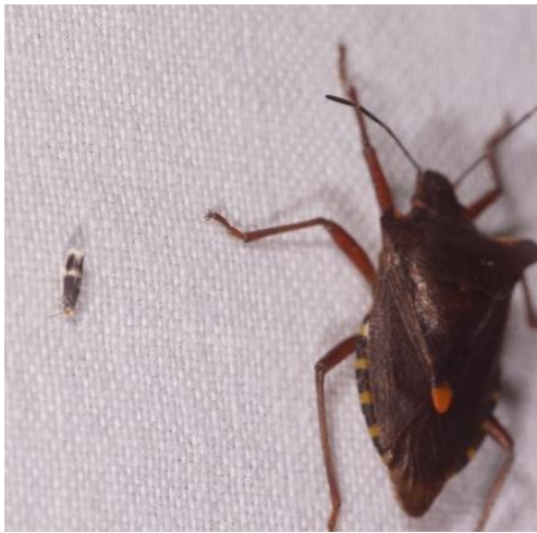
Een voorbeeld van de hele kleine is deze Zuidelijke berkenmineermot die naast een Roodpootwants zit

In 2022 is er dan ook weer 22 keer 's avonds en 1 keer overdag 'genachtulinderd' door de ulinder werkgroep van IVN Maasduinen. Met een wisselend resultaat en uiteindelijk een heel mooi jaarresultaat. Uiteindelijk hebben we in totaal maar liefst 547 unieke soorten gezien! Van hele kleine soorten van nog geen 3 mm lang tot de grote pijlstaarten.