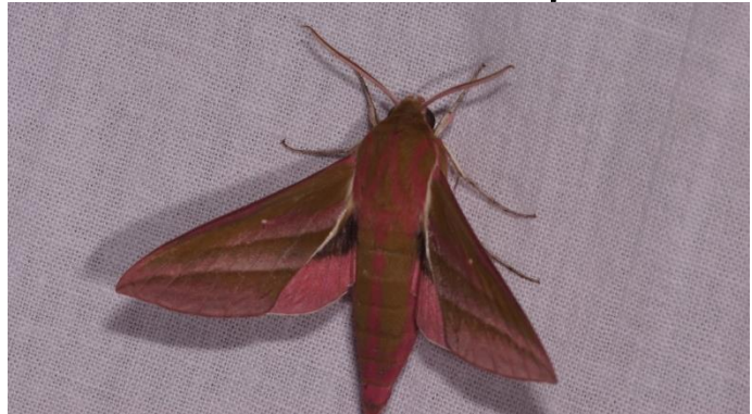
En dan een Groot Avondrood als een van de grotere ulinders en één van de pijlstaarten.