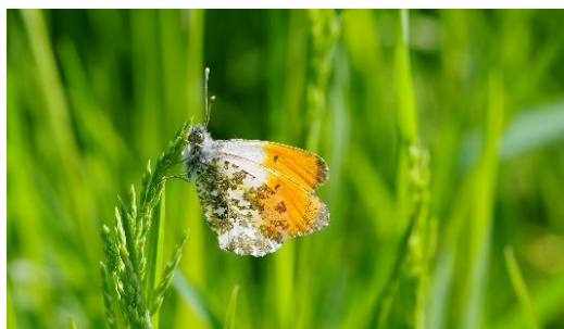
Foto's oranjetipje man