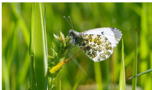
Foto's vrouw oranjetipje, ze legt net haar eitjes op de pinksterbloem

Het was een mooie ochtend zaterdag 13 mei in de Bunt. Er zijn een aantal waarnemingen gedaan: oranjetipje (zie meerdere foto's), landkaartje (zie foto), citroenvlinder, koolwitjes, dagpauwoog, geaderd witje, kleine vuurvlinder en drie reeën. Het oranjetipje legt gele eitjes en die kleuren na enige tijd naar oranje.