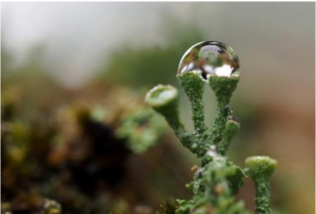
Bekertjes mos met dauwdruppel Alie van den Brandhof

Dit kan via: ivnfotobarneveld@gmail.com ) of via 06 308 15032.