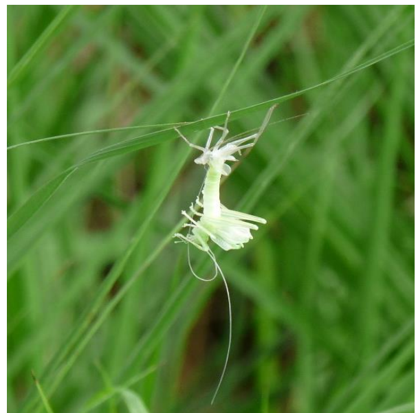
Vervelling sprinkhaan. Mariapeel

De fotowerkgroep exposeerde met foto's met het thema 'De vier jaargetijden' vanaf 4 april. Eerst in Het Westhoffhuis in Lunteren en aan het einde van het jaar is de expositie in Putten te zien geweest. Ook werd er door de fotowerkgroep maandelijks een foto van de maand uitgekozen.