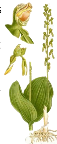
Grote Keverorchis Kwintelooyen

Arie heeft zich beziggehouden met natuuronderzoek van een Weidegebied bij het Schoolsteegbosje noord in Leusden. Een aantal van ons zagen daar het resultaat van het afplaggen; jonge kiemplanten schoten overal uit de grond.