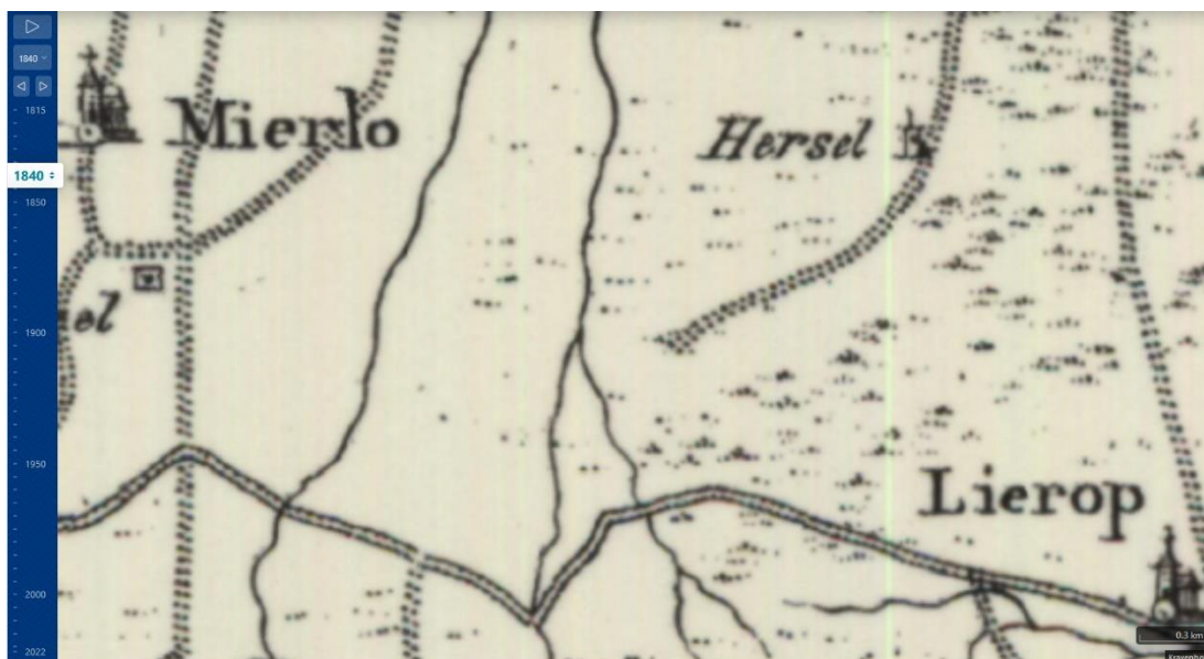
Topografische kaart Gebergte 1840

Zo rond 1840 was – buiten de laagte van Sang en Goorkens– het hele bosgebied tussen Lierop en Mierlo een open heidelandschap met stuifduinen.