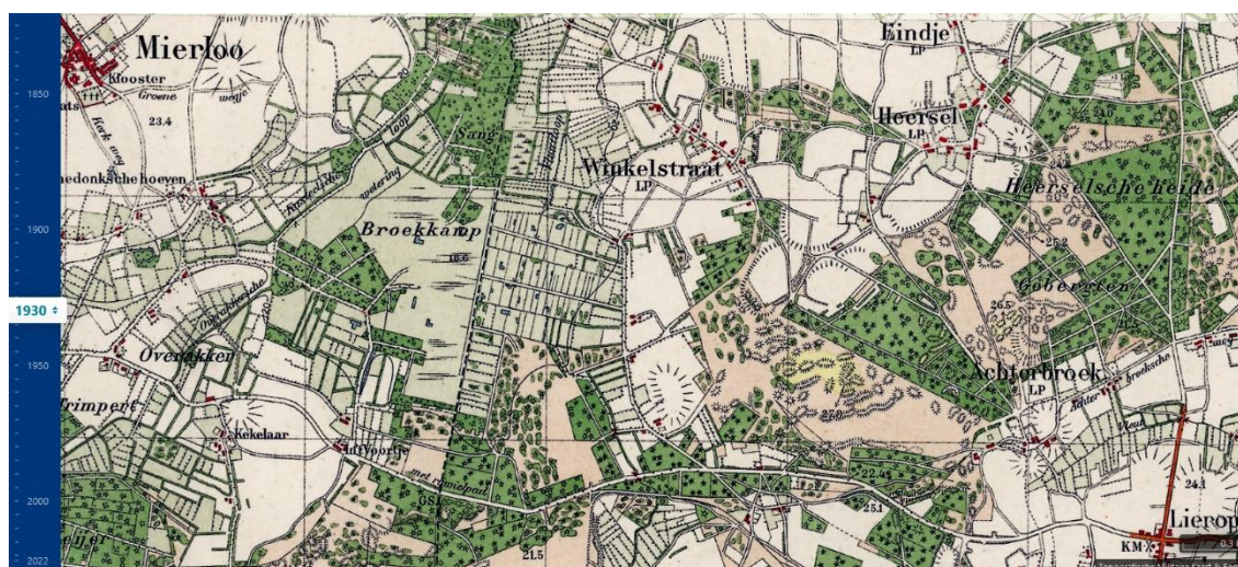
Topografische kaart Gebergte 1930

De commissaris van de Koningin, jhr van Voorst tot Voorst bezocht begin 1900 ook Lierop en werd getroffen door de armoede en de overlast door stuivend zand en bepleitte bij SBB de aanplant van dennen. De eerste aanplant in Someren vond in dit gebied plaats.