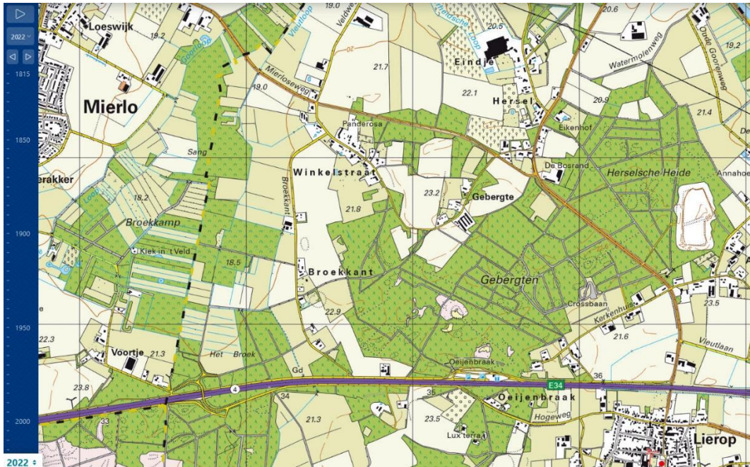
Topografische kaart Gebergten 2022