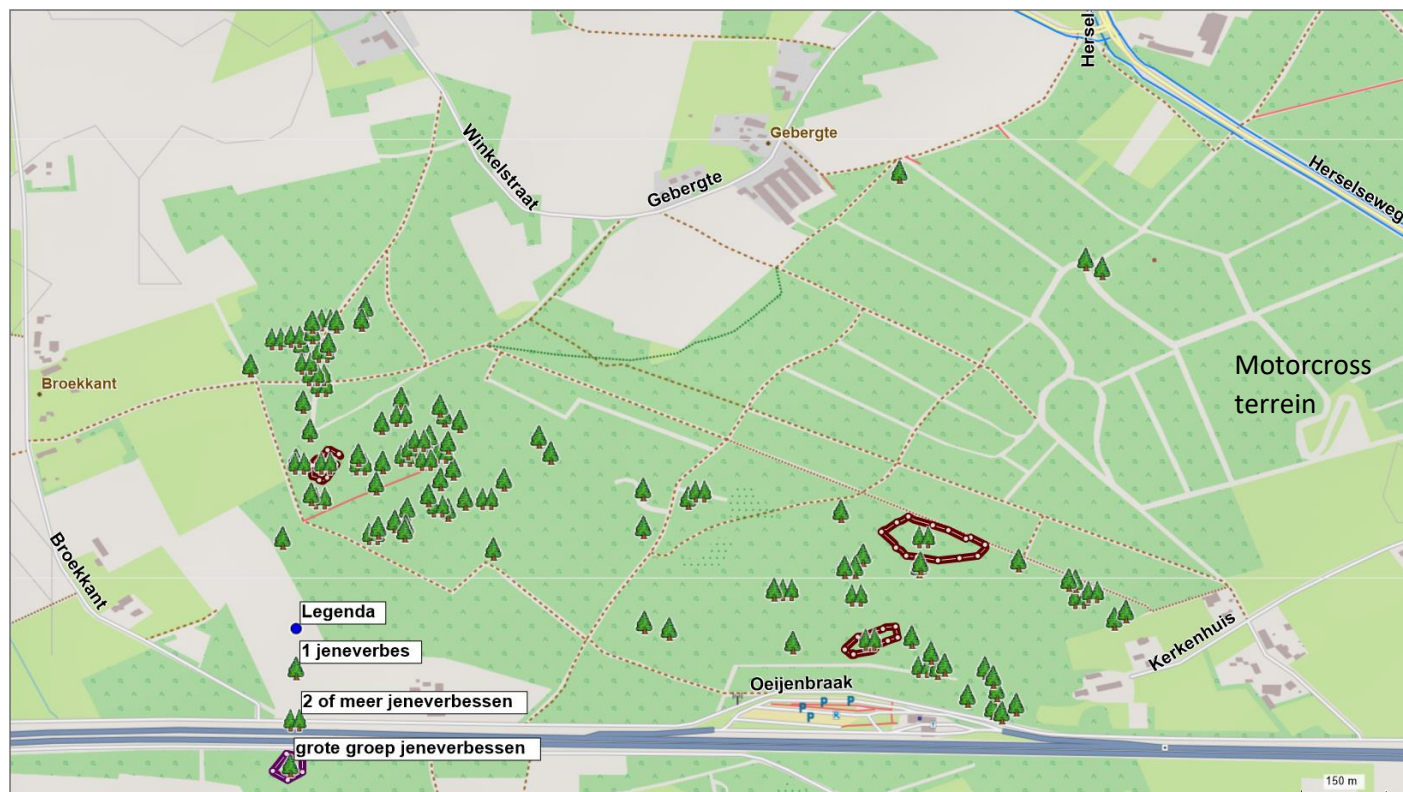
Jeneverbessen in het Gebergten

Wat op de huidige topografische kaart ook niet toont is de grote verzameling jeneverbessen -een rode lijst soort- in een deel van het gebied (binnen de bruin omcirkelende gebieden staan grotere groepen).