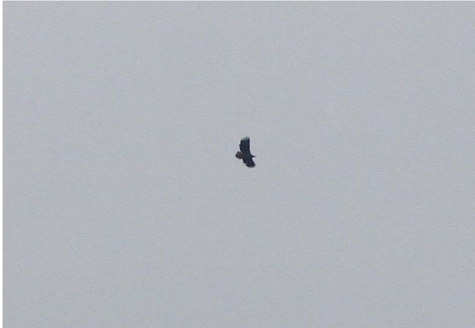
Zeearend 05-10-2019