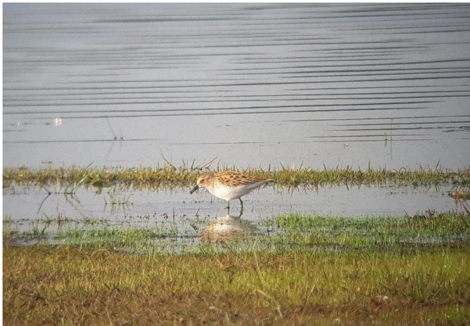
Kleine Strandloper 23-05-2019

23 -05- t/m 24-05-2019: Een Kleine Strandloper verbleef deze dagen op het Beuven.