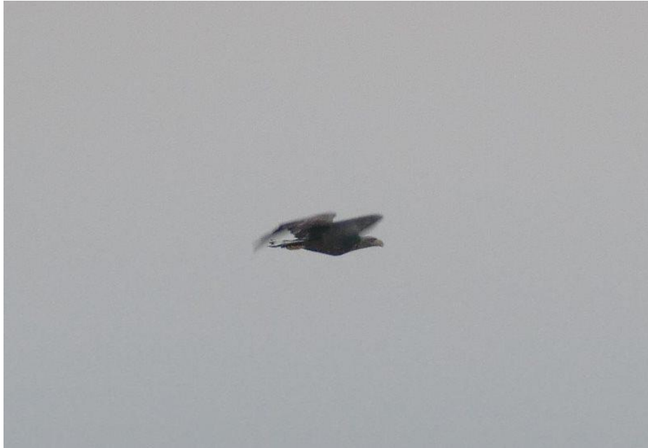
Zeearend 21-04-2019

21-04-2019: Op 21 april verbleef na een vermoedelijke overnachting weer een adulte Zeearend op het Beuven. Na korte tijd leek de vogel vertrokken, maar vanaf 11:19 vloog de Zeearend weer enige tijd boven het gebied.