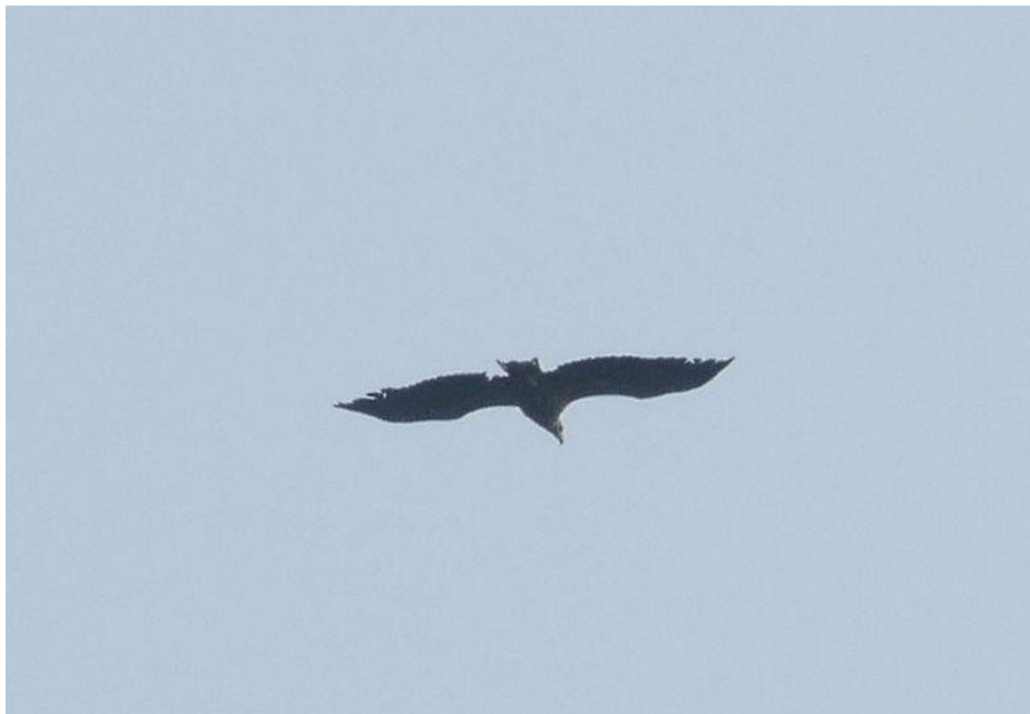
Zeearend 14-04-2019

14 -04-2019: Een onvolwassen Zeearend vloog vanaf 11:10 enige tijd boven de Strabrechtse Heide.