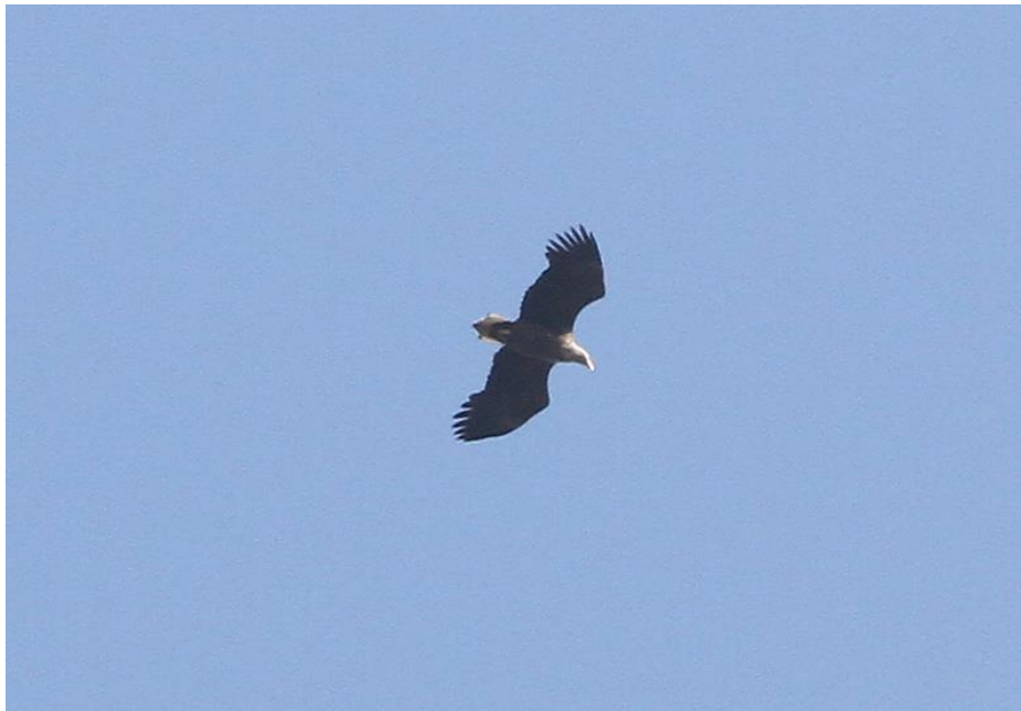
Zeearend 30-03-2019

30-03-2019: Een adulte Zeearend trok om 13:08 richting zuid over het gebied.