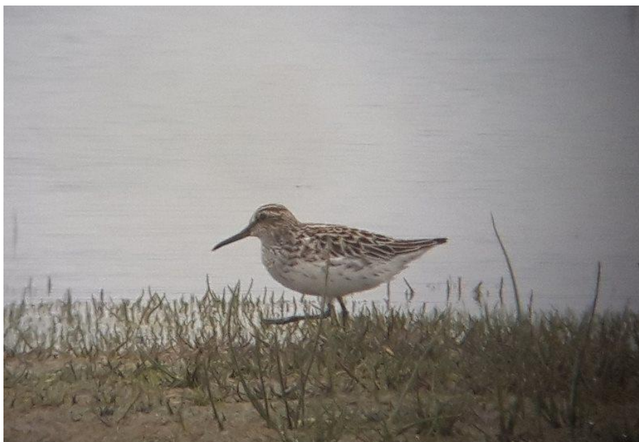
Breedbekstrandloper 20-05-2019