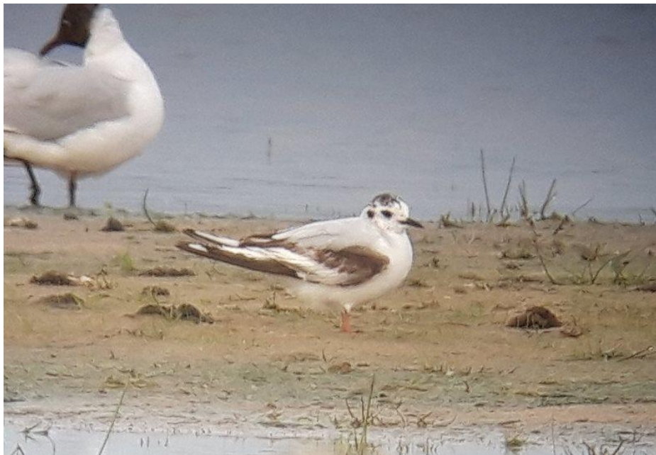
Dwergmeeuw 03-05-2019

03-05-2019: Een 1 e zomer Dwergmeeuw was kort ter plaatse op het Beuven.