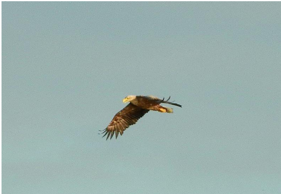
Zeearend 16-05-2019