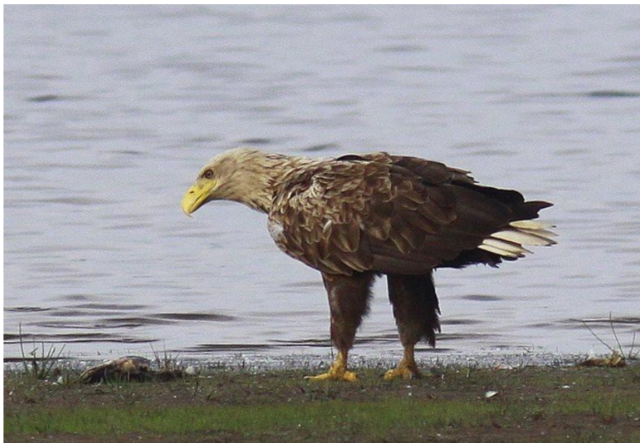
Zeearend 26-05-2019