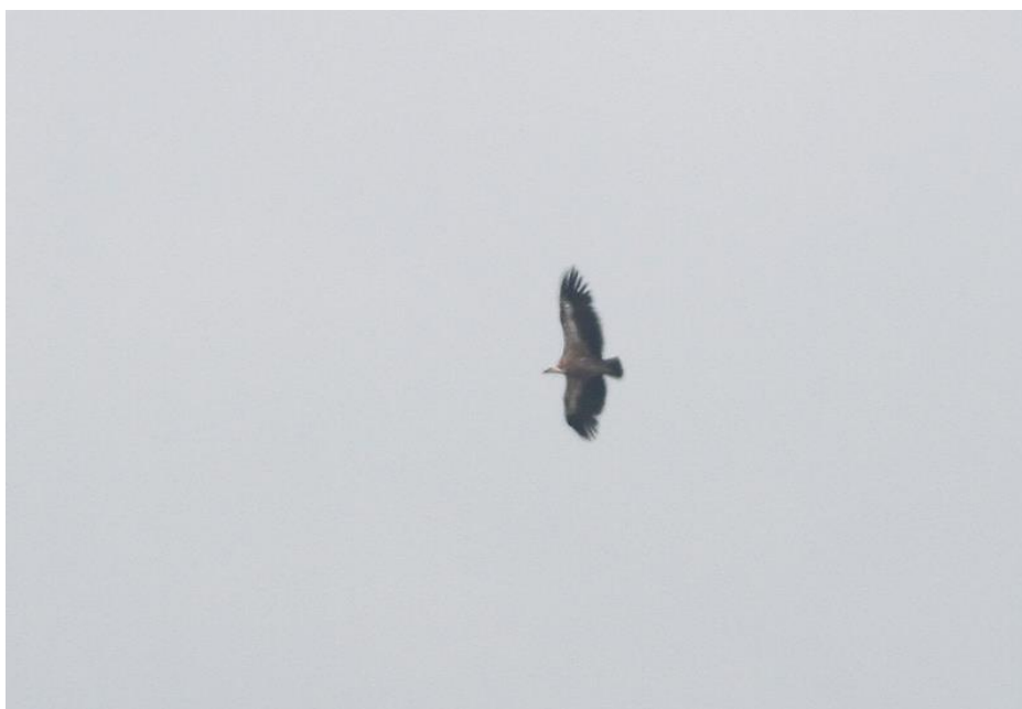
Vale Gier 19-05-2019

19-05-2019: Op 19 mei werd weer een spectaculaire soort waargenomen. Om 13:50 trok een Vale Gier richting NO over het gebied.