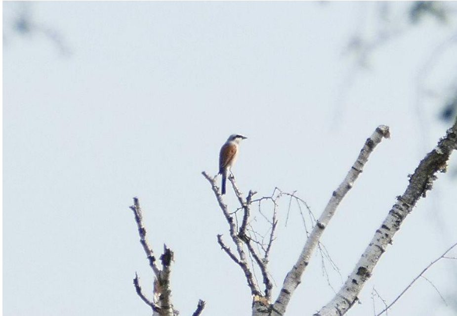
Grauwe Klauwier 24-05-2019