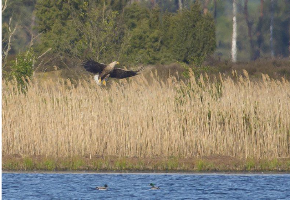
Zeearend 16-05-2019