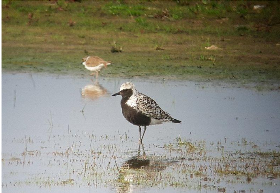
Zilverplevier 03-05-2019