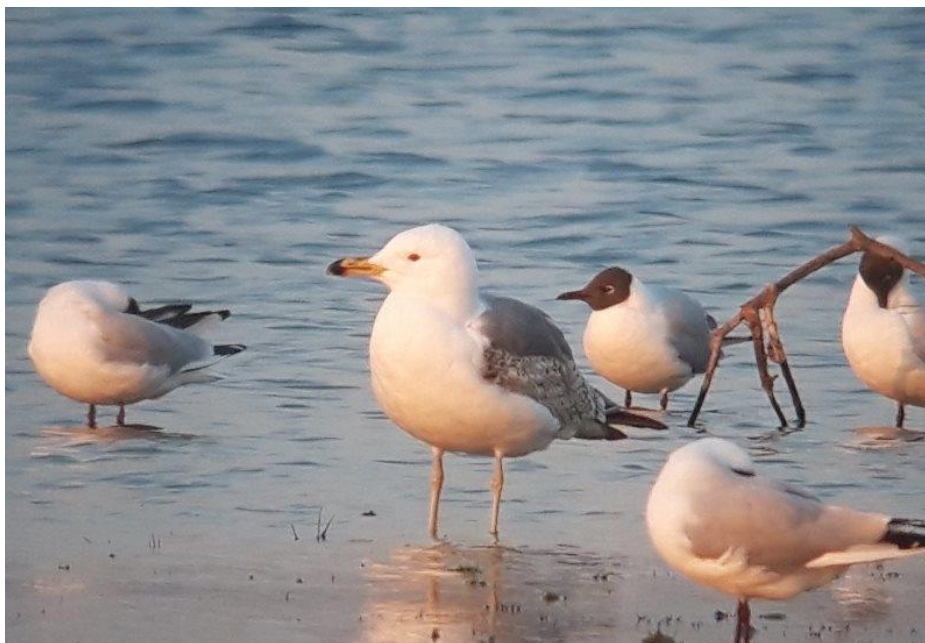
Geelpootmeeuw 16-04-2019

30 -03- t/m 10-05-2019: Een KJ3 Geelpootmeeuw was deze periode aanwezig op het Beuven. De vogel was gepaard met een Kleine Mantelmeeuw.