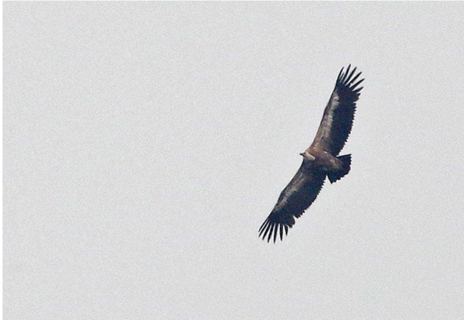
Vale Gier 19-05-2019