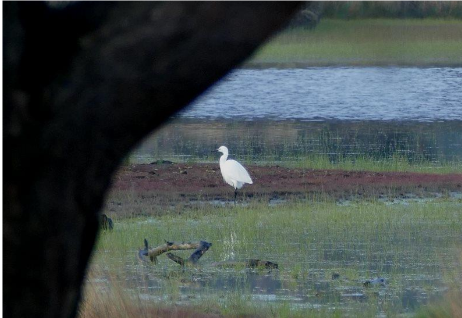
Kleine Zilverreiger 10-05-2019