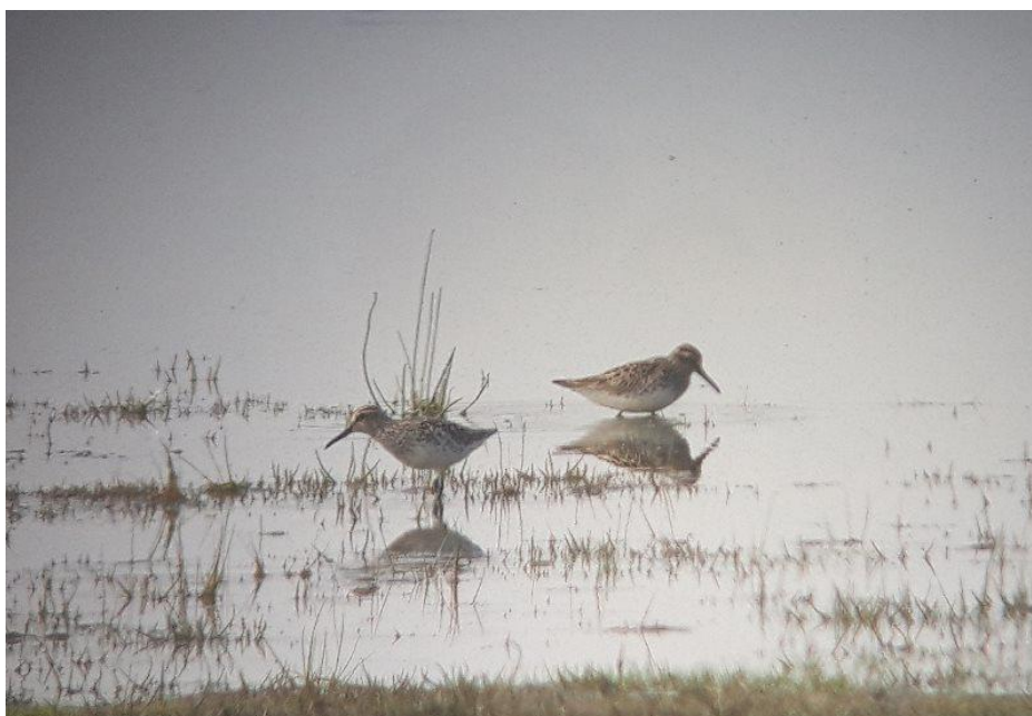
Breedbekstrandlopers 18-05-2019

18 -05- t/m 21-05-2019: Spectaculair was de ontdekking van twee Breedbekstrandlopers op 18 mei op het Beuven. De vogels werden 's ochtends gevonden en zijn aanwezig geweest tot en met 21 mei.