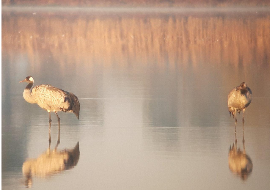
Kraanvogels 27-02-2019