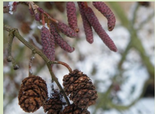
Natuurgidsen vertellen over winterzwammen en winterkenmerken van bomen en struiken

De Snertwandeling is traditie getrouw een heel gezellige start van het nieuwe jaar voor KNNV en IVN. Het is een mooie gelegenheid om even samen bij te praten. U komt toch ook?!