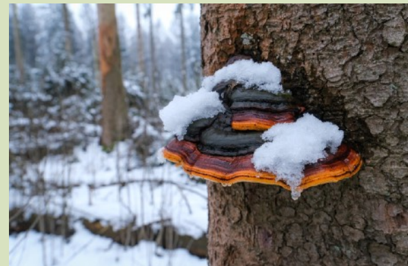
Roodgerande houtzwam

De wandeling start om 13.00 uur op de grote parkeerplaats met informatiebord in de bocht aan de Houtvester Jansenweg tussen 't Nije Hemelriek en Eexterhalte. Na ongeveer 2 uur kom je weer terug bij het beginpunt. Deelname kost € 2,50 voor leden van IVN-KNNV en € 5,00 voor niet-leden.