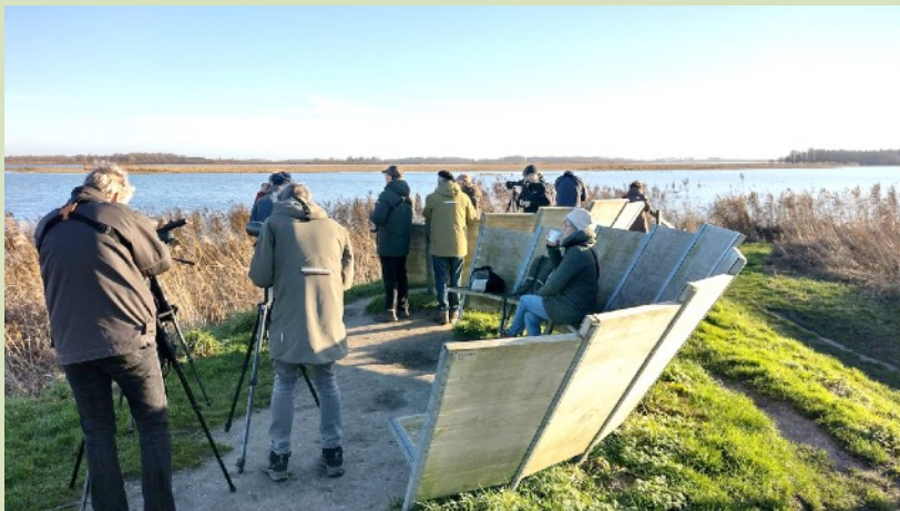
Telescopen in de aanslag