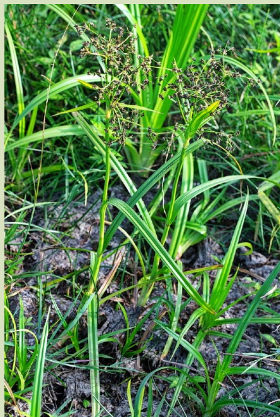
Bosbies (Scirpus sylvaticus) op Tichelhoes