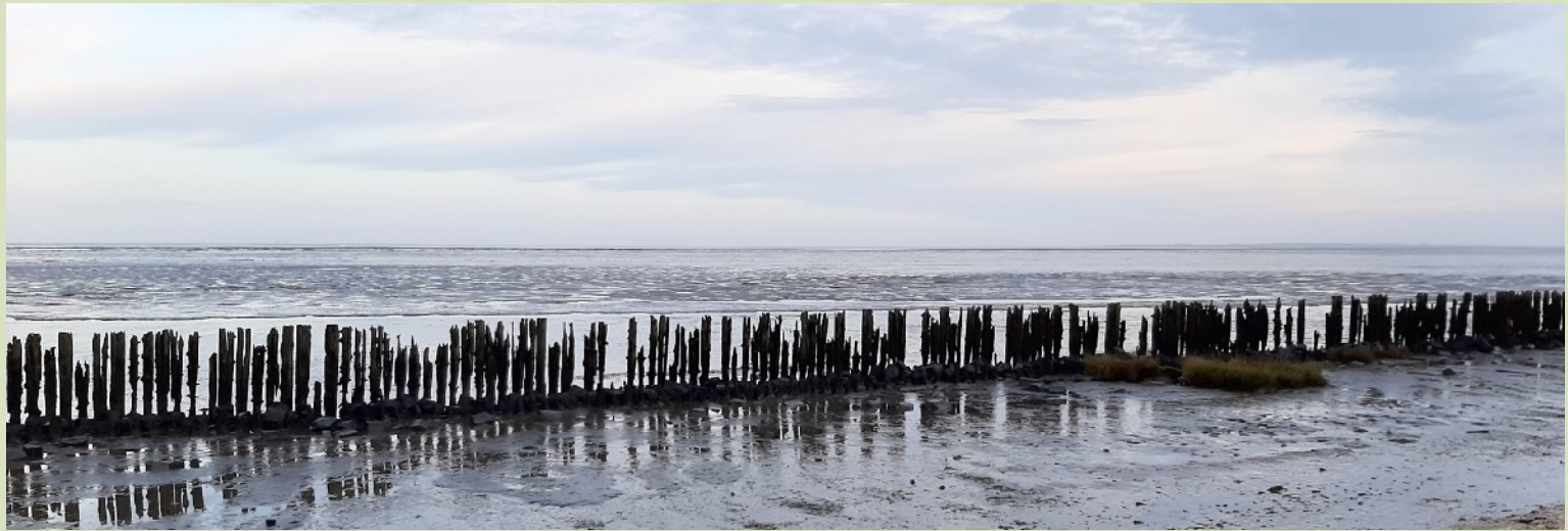
De Wadden bij Moddergat