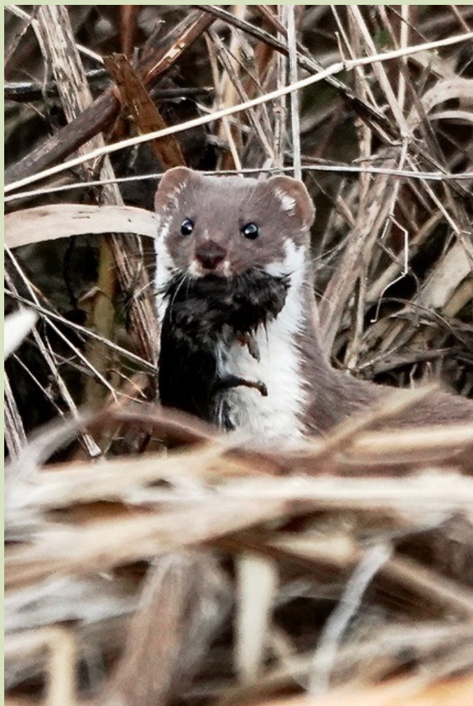
Wezeltje met prooi