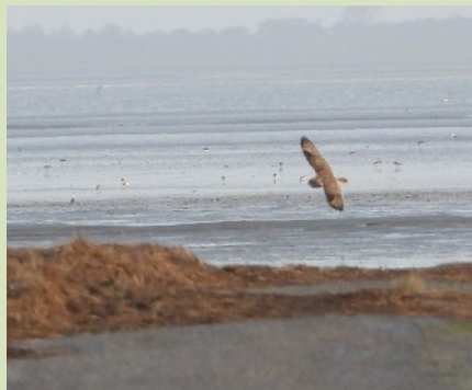
Velduil (foto: HM)

naar de Haven, waar Heleen een paartje Sneeuwgorzen ontdekt (foto MB). Meerdere Zeehonden liggen lekker te zonnen (foto HM). Tot slot doen we Ezumakeeg aan. De Cetti's Zanger laat zich hier horen vanuit het riet, evenals de Waterral. De telescopen worden weer opgezet voor de vogels die wat verder weg zitten (foto WdV), zoals Pijlstaarten en weer veel Bergeenden (foto MB). Guido roept plots: 'jaaaa, ik heb ze!' En ja hoor: in een kaal boompje aan de overkant zit het paar Zeearend. Daarna komt nóg een uitsmijter: Michel ziet hoe een klein roofdiertje uit het riet tevoorschijn komt; het beestje ziet ons en schiet daarop meerdere keren weer terug het riet in. Maar uiteindelijk komt hij, een Wezeltje - mét prooi (foto MM) - weer tevoorschijn en snelt weg het vaste land op. Mooier wordt het niet, denken we; en gaan we tevreden na deze zeer geslaagde dag naar huis.